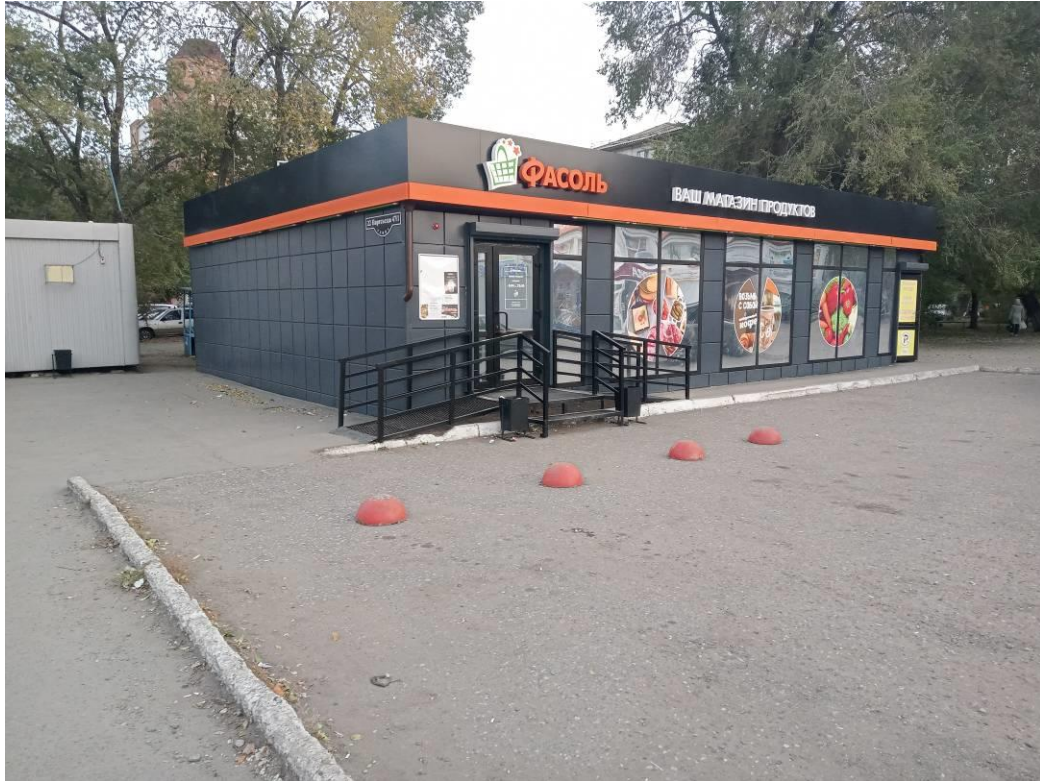
г. Омск, Центральный АО, в 20-25 м. северо-восточнее многоквартирного дома № 94 по ул. 22 Партсъезда