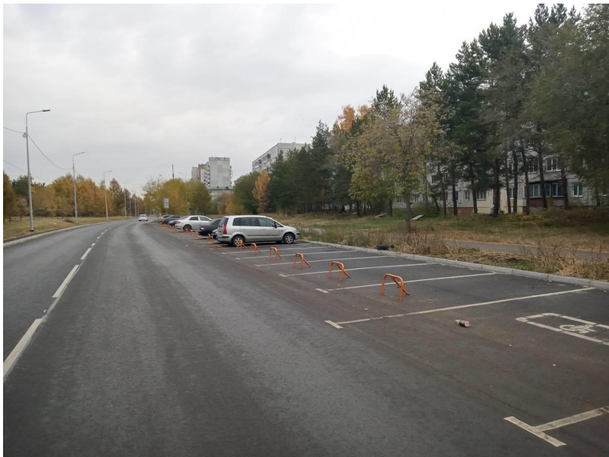
г. Омск, Кировский АО, в 36 м. западнее многоквартирного дома № 15 по ул. Лукашевича