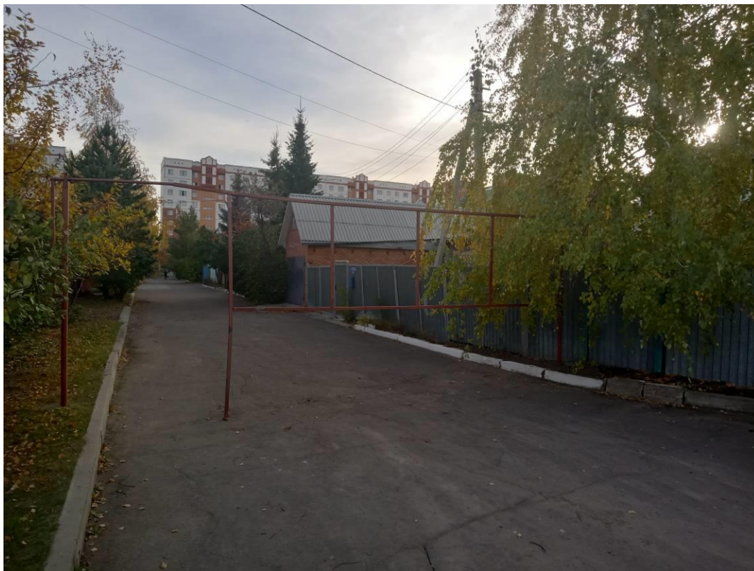
г. Омск, Центральный АО, в 9 м. северо-западнее индивидуального жилого дома № 13/5 по ул. Завертяева