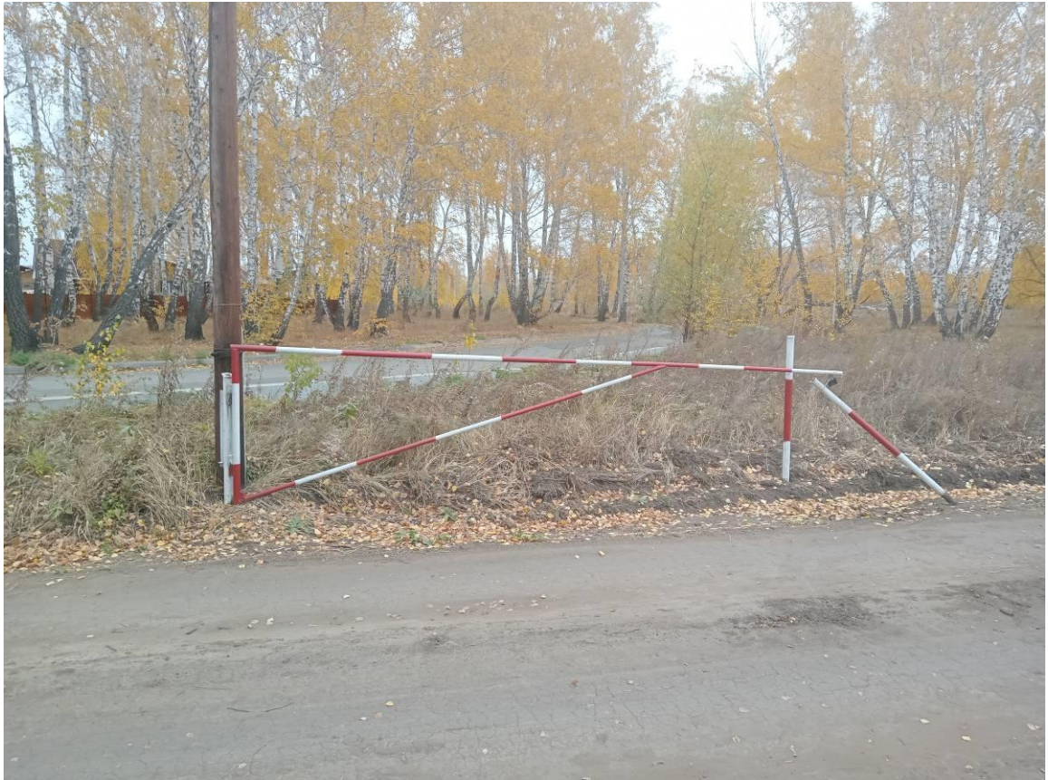
г. Омск, Ленинский АО, в 66 м. юго-восточнее индивидуального жилого дома № 4 по ул. Ивовая