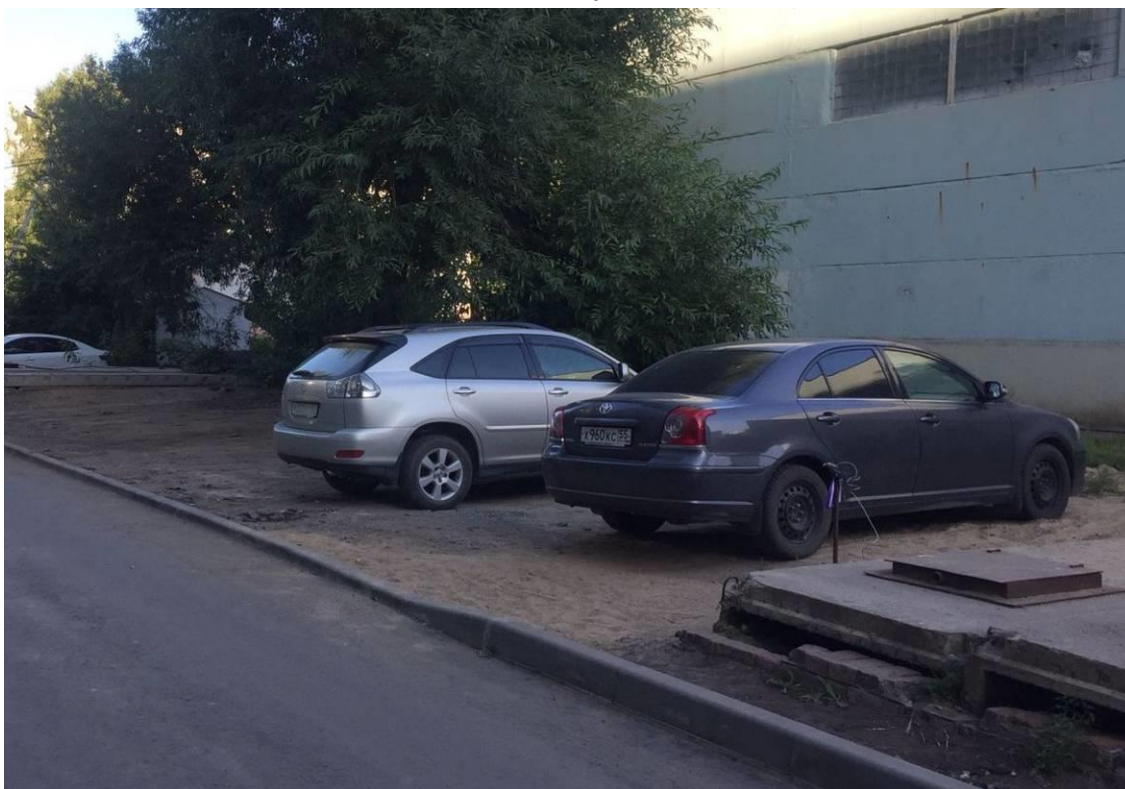
г. Омск, Кировский АО, в 11 м. юго-восточнее многоквартирного дома № 11 по ул. Дмитриева