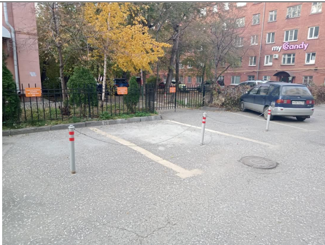
г. Омск, Центральный АО, в 7 м. южнее здания № 32 по проспекту Карла Маркса