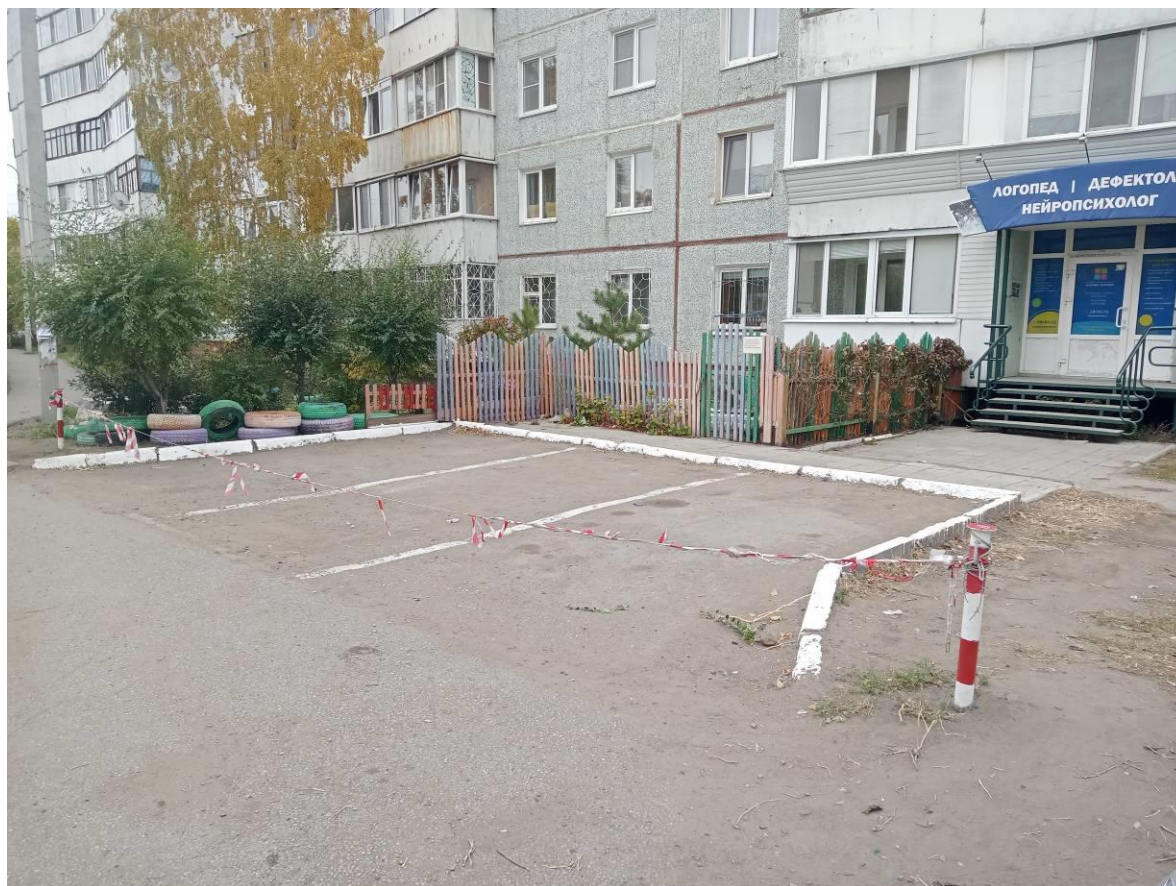
г. Омск, Октябрьский АО, в 12 м. юго-восточнее многоквартирного дома № 18/2 по ул. Кирова