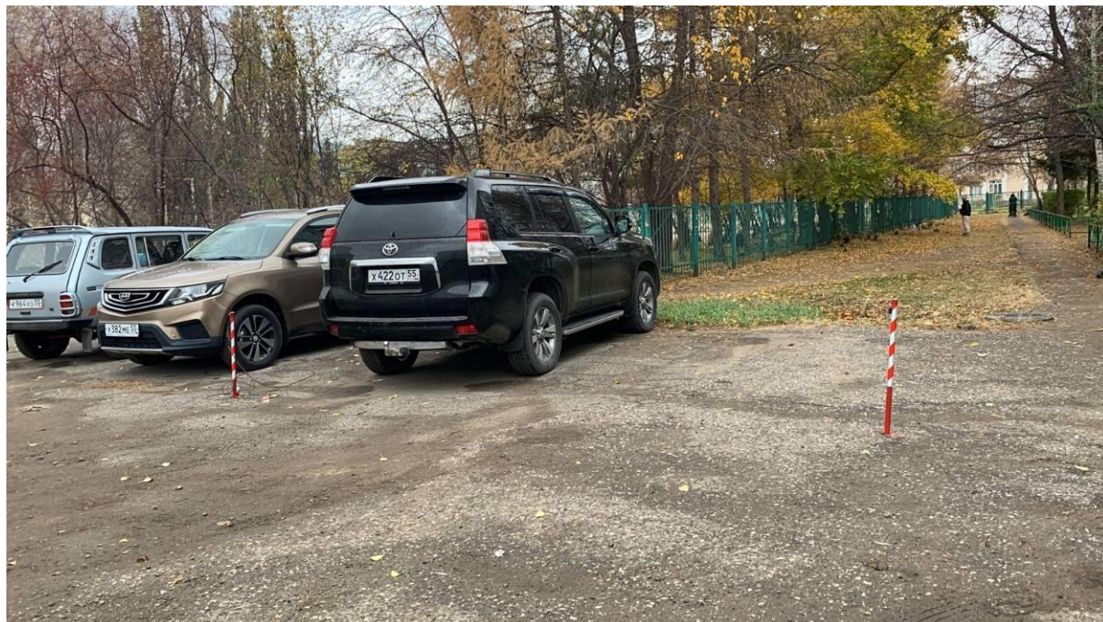
г. Омск, Кировский АО, в 14-20 м. юго-восточнее многоквартирного дома № 23, корпус 1 по просп. Комарова