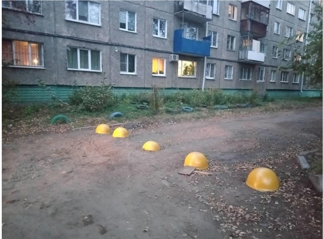
г. Омск, Ленинский АО, в 8-12 м. южнее многоквартирного дома № 7 по ул. С. Стальского