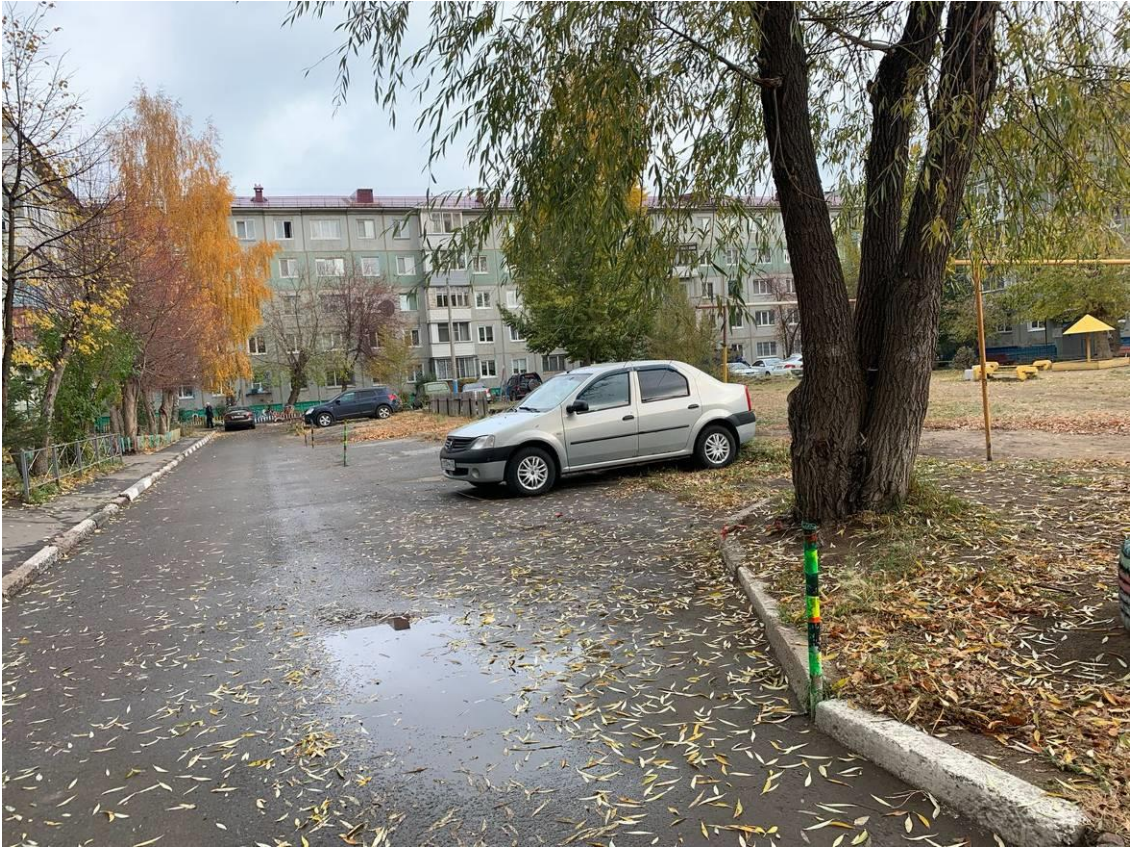
г. Омск, Кировский АО, в 15-35 м. северо-восточнее многоквартирного дома № 6А по ул. Бережного