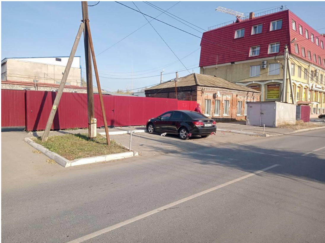
г. Омск, Центральный АО, в 8-25 м. юго-западнее индивидуального жилого дома № 161 по ул. Яковлева