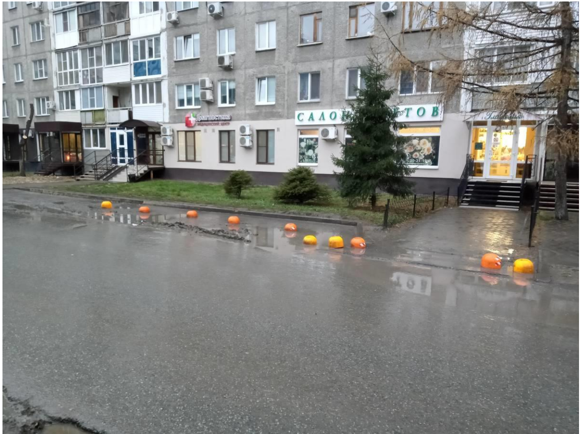
г. Омск, Центральный АО, в 10 м. северо-восточнее многоквартирного дома № 15 по ул. Волочаевская