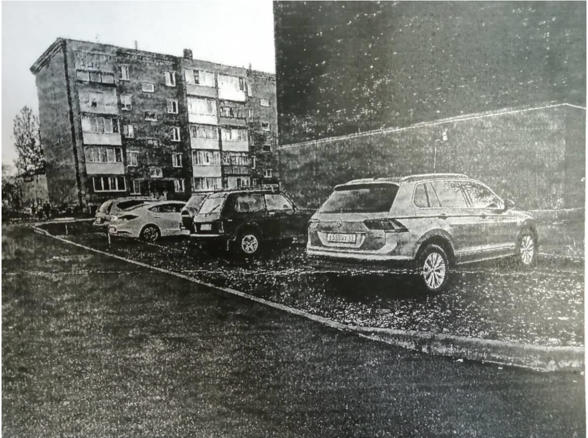
г. Омск, Октябрьский АО, в 6 м. восточнее многоквартирного дома № 14 по ул. Крутогорская