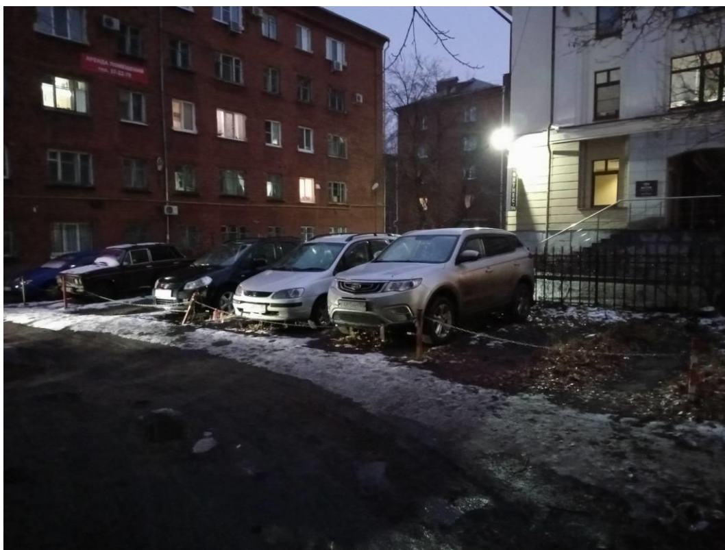
г. Омск, Центральный АО, в 7-23 м. северо-западнее многоквартирного дома № 34 по просп. Карла Маркса