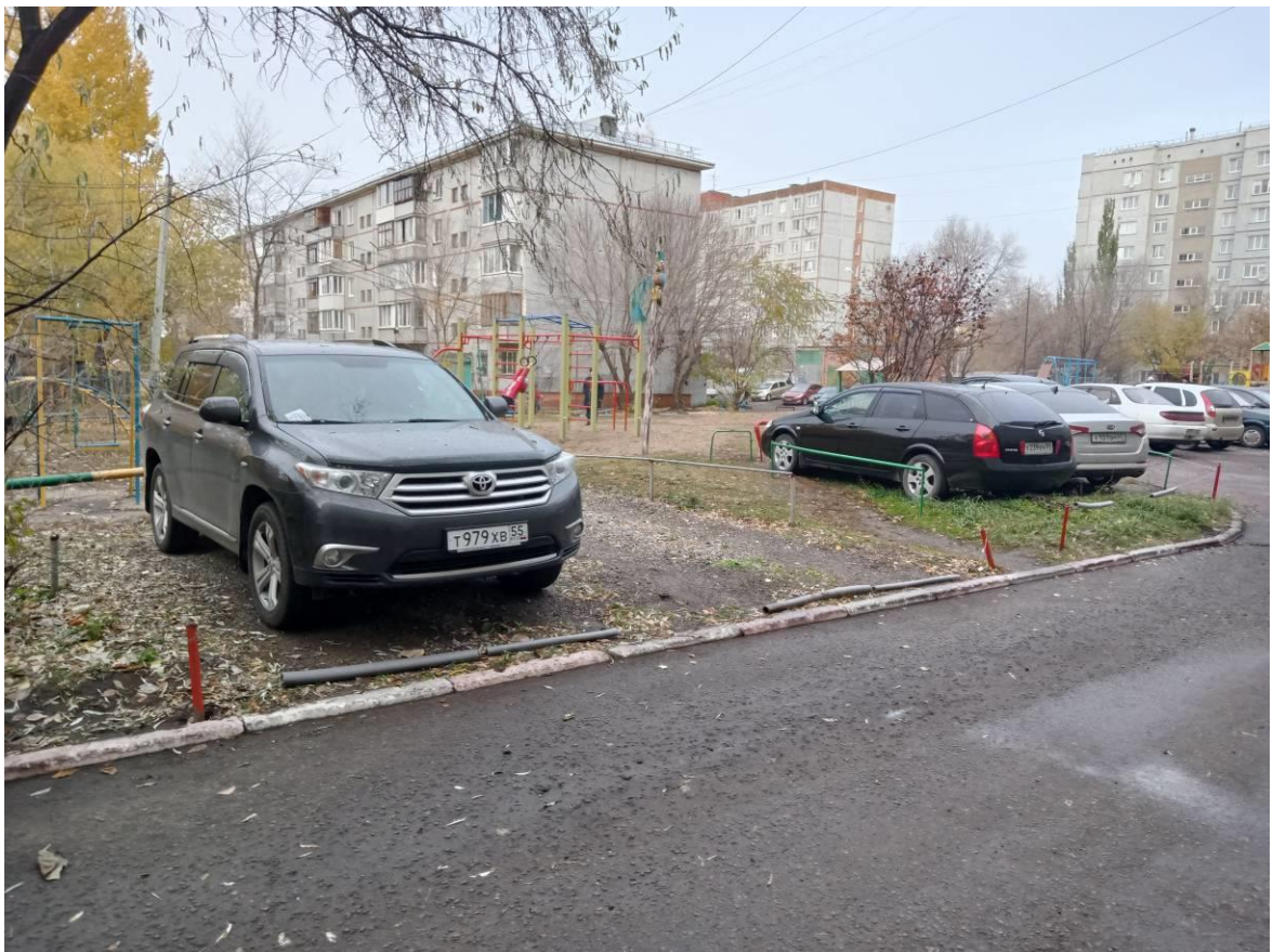
г. Омск, Кировский АО, в 14-20 м. севернее многоквартирного дома № 6 по ул. Дианова