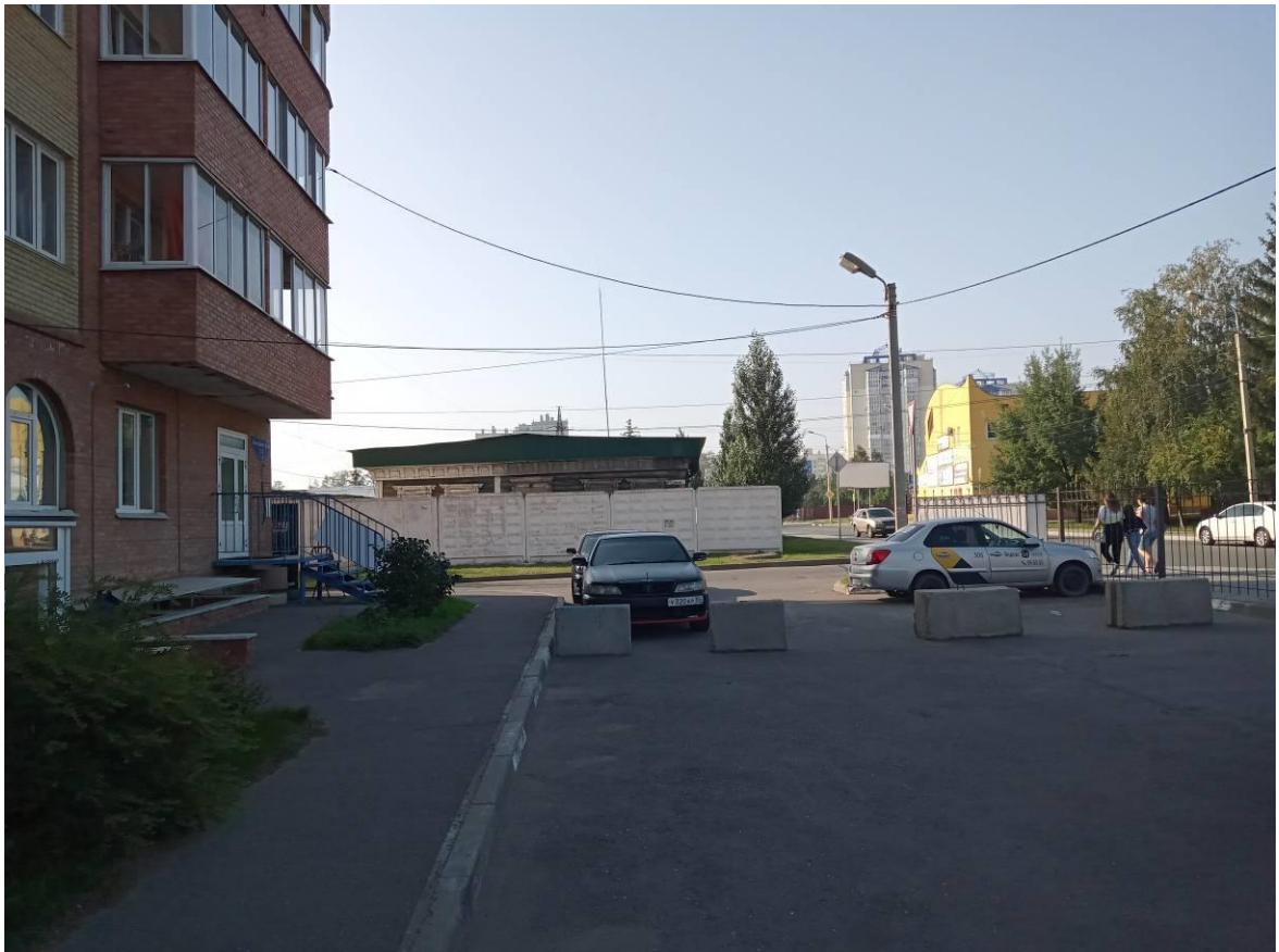
г. Омск, Советский АО, в 6-12 м. северо-восточнее многоквартирного дома № 11 по ул. Волховстроя