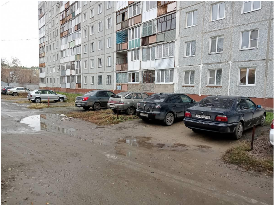
г. Омск, Кировский АО, в 11 м. северо-западнее многоквартирного дома № 112 по ул. 12 Декабря