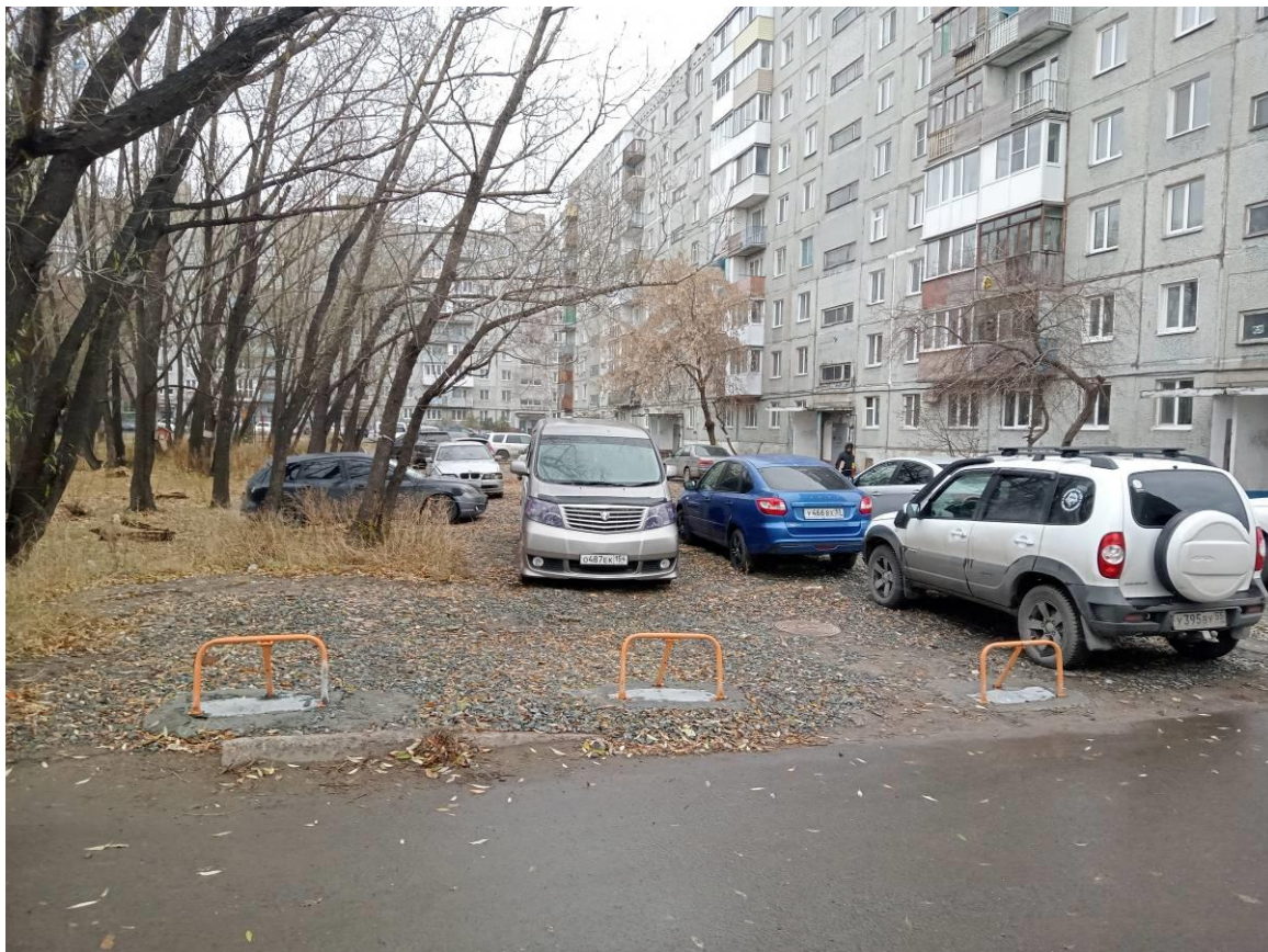
г. Омск, Центральный АО, в 8-22 м. северо-западнее, севернее и северо-восточнее дома № 195 по ул. 5-я Северная