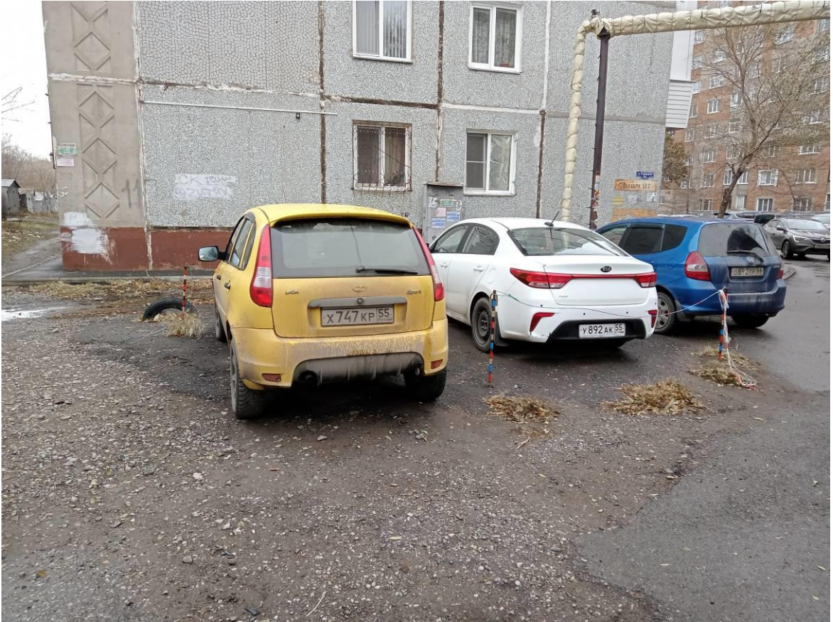
г. Омск, Кировский АО, в 5-8 м. юго-западнее многоквартирного дома № 112 по ул. 12 Декабря