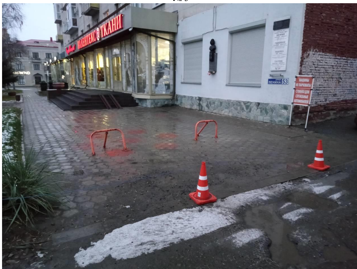
г. Омск, Центральный АО, в 3-6 м. юго-восточнее многоквартирного дома № 53 по ул. Ленина