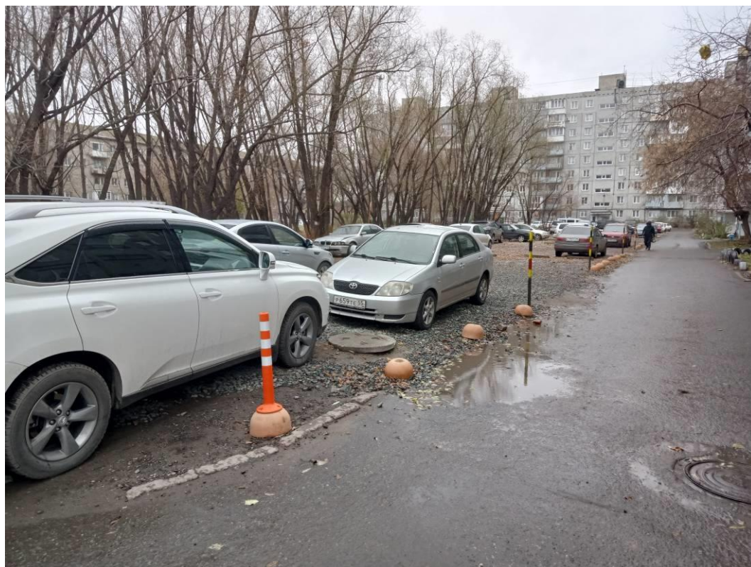
г. Омск, Центральный АО, в 8-22 м. северо-западнее, севернее и северо-восточнее дома № 195 по ул. 5-я Северная