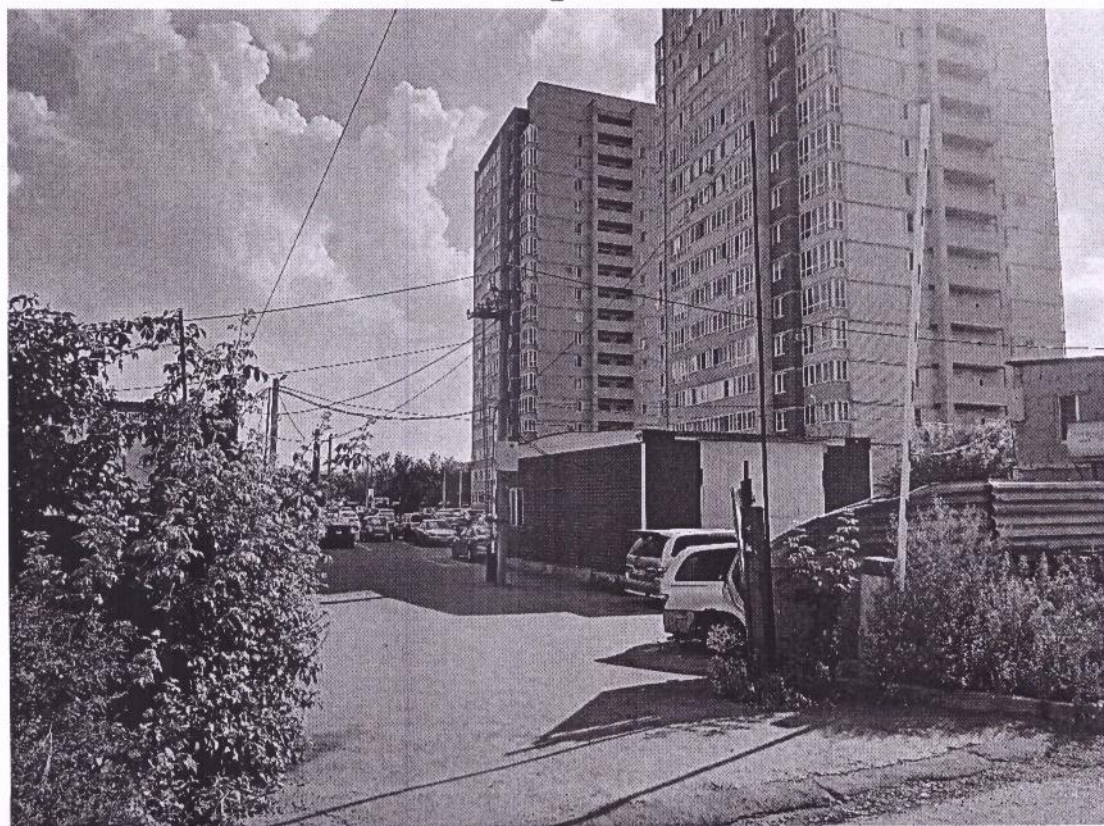
г. Омск, Октябрьский АО, в 20 м. северо-восточнее здания 3/1 по ул. 4-я Транспортная