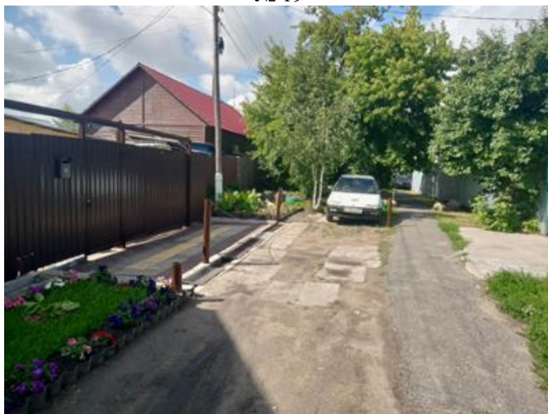
г. Омск, Кировский АО, в 10-25 м. индивидуального жилого дома № 18 по ул. 2-й переулок 12 Декабря