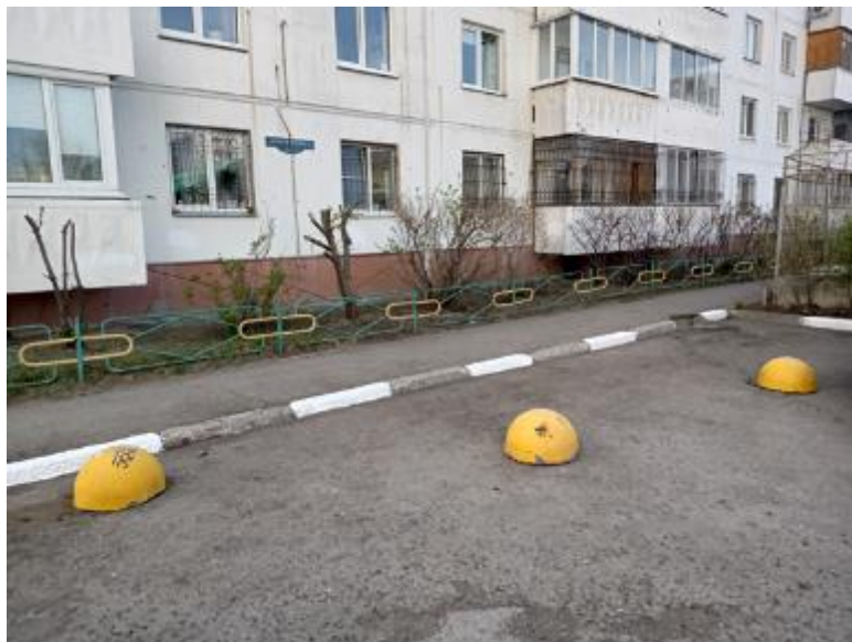
г. Омск, Кировский АО, в 7-8 м. северо-западнее многоквартирного дома № 1/2 по ул. Дмитриева