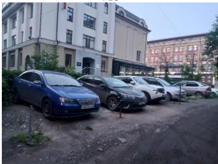
г. Омск, Центральный АО, в 7-18 м. северо-западнее многоквартирного дома № 34 по просп. Карла Маркса