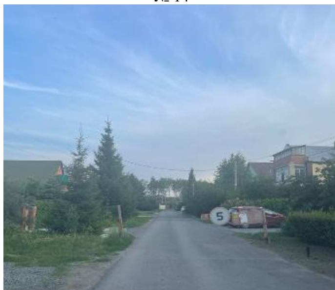
г. Омск, Кировский АО, в 18 м. юго-восточнее индивидуального жилого дома № 5 по ул. 12-я Любинская