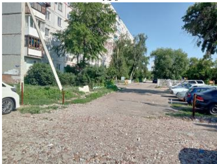
г. Омск, Ленинский АО, в 15-20 м. юго-восточнее многоквартирного дома № 91 по ул. Демьяна Бедного