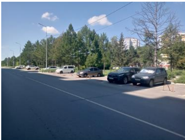
г. Омск, Кировский АО, в 34 м. западнее многоквартирного дома № 21 по ул. Лукашевича