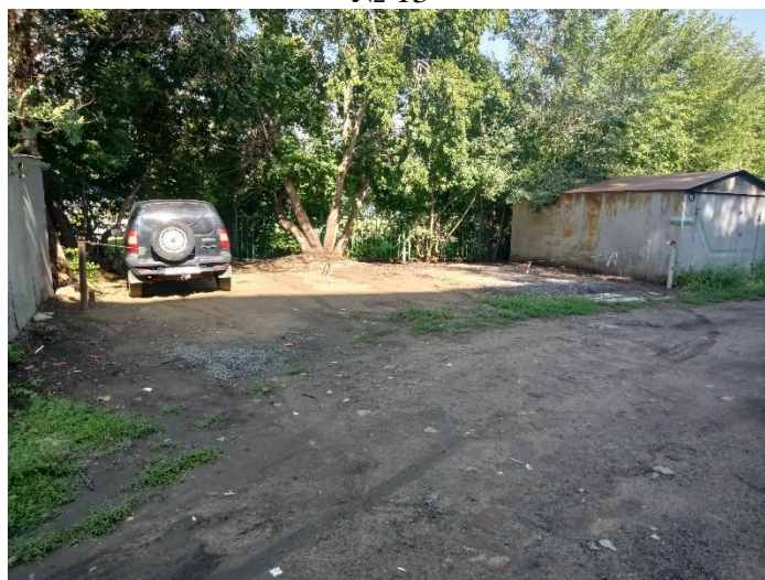
г. Омск, Кировский АО, в 7-8 м. северо-западнее многоквартирного дома № 1/2 по ул. Дмитриева