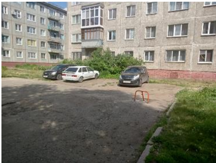
г. Омск, Центральный АО, в 11 м. северо-западнее многоквартирного дома № 21Б по ул. Краснознаменная