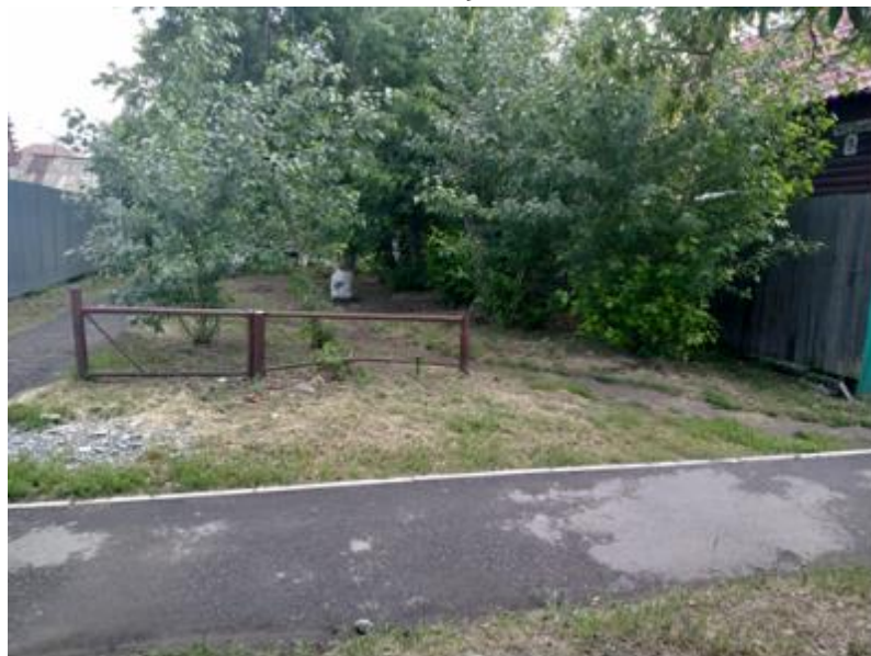
г. Омск, Кировский АО, в 6 м. северо-западнее индивидуального жилого дома № 18 по ул. 2-й переулок 12 Декабря