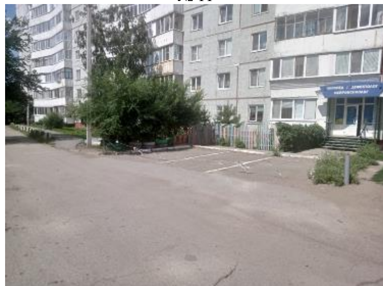
г. Омск, Октябрьский АО, в 12 м. юго-восточнее многоквартирного дома № 18/2 по ул. Кирова