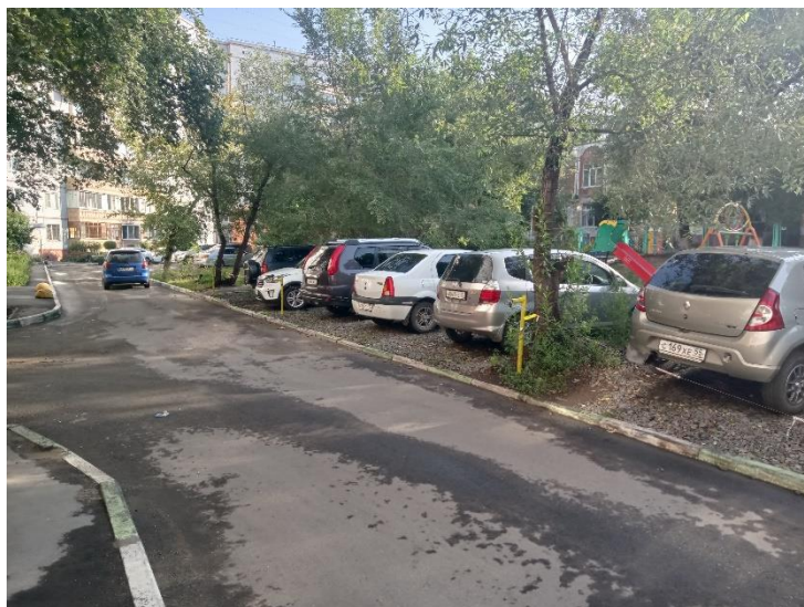
г. Омск, Центральный АО, в 10 м. восточнее многоквартирного дома № 27/2 по ул. Куйбышева