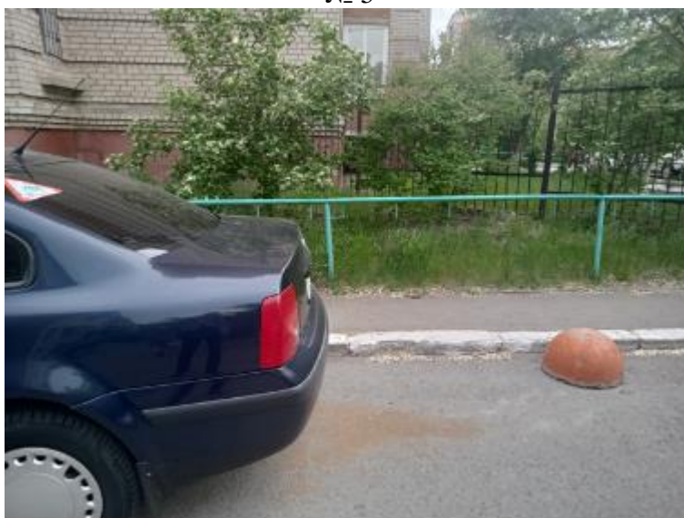
г. Омск, Ленинский АО, в 7 м. западнее многоквартирного дома № 26А по ул. Серова