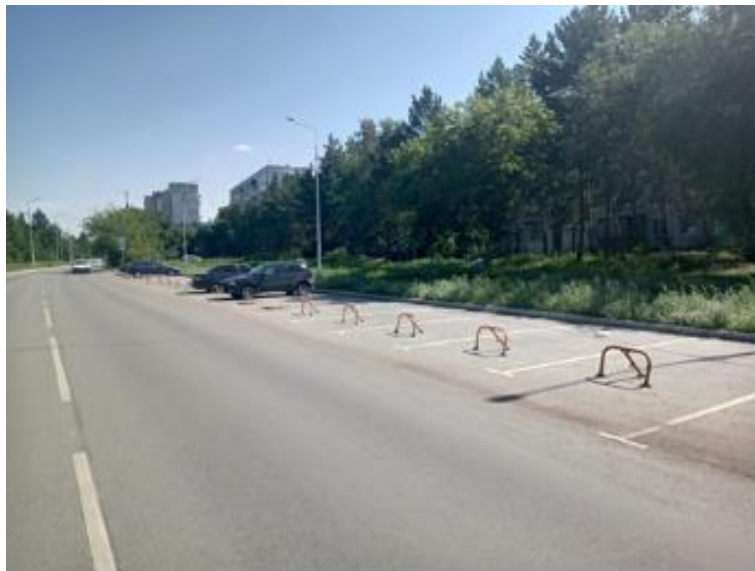
г. Омск, Кировский АО, в 36 м. западнее многоквартирного дома № 15 по ул. Лукашевича