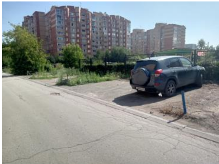
г. Омск, Кировский АО, в 20-38 м. юго-восточнее многоквартирного дома № 2 корпус 1 по ул. Туполева