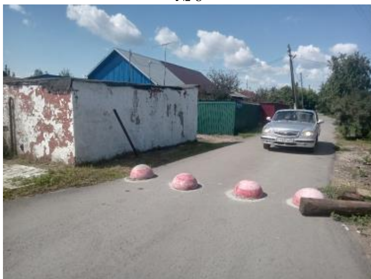
г. Омск, Ленинский АО, в 12-15 м. северо-восточнее индивидуального жилого дома № 22 по ул. 3-я Полевая