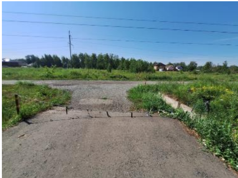
г. Омск, Ленинский АО, в 18 м. юго-западнее индивидуального жилого дома № 31 по ул. Лобова