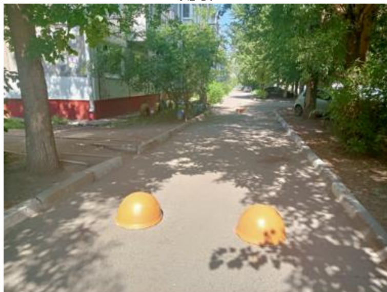
г. Омск, Кировский АО, в 7-9 м. юго-восточнее многоквартирного дома № 19 по ул. Лукашевича