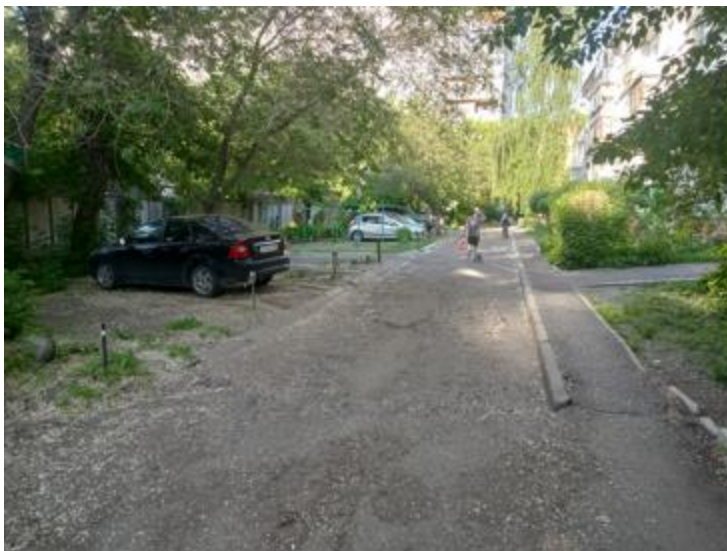
г. Омск, Центральный АО, в 11 м. севернее многоквартирного дома № 137 по ул. Декабристов