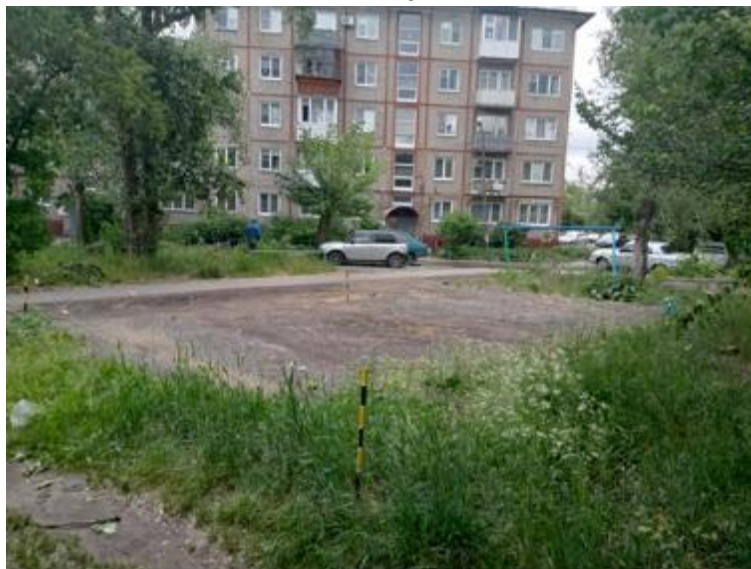
г. Омск, Октябрьский АО, в 10-30 м. юго-западнее многоквартирного дома № 4 по ул. Товстухо