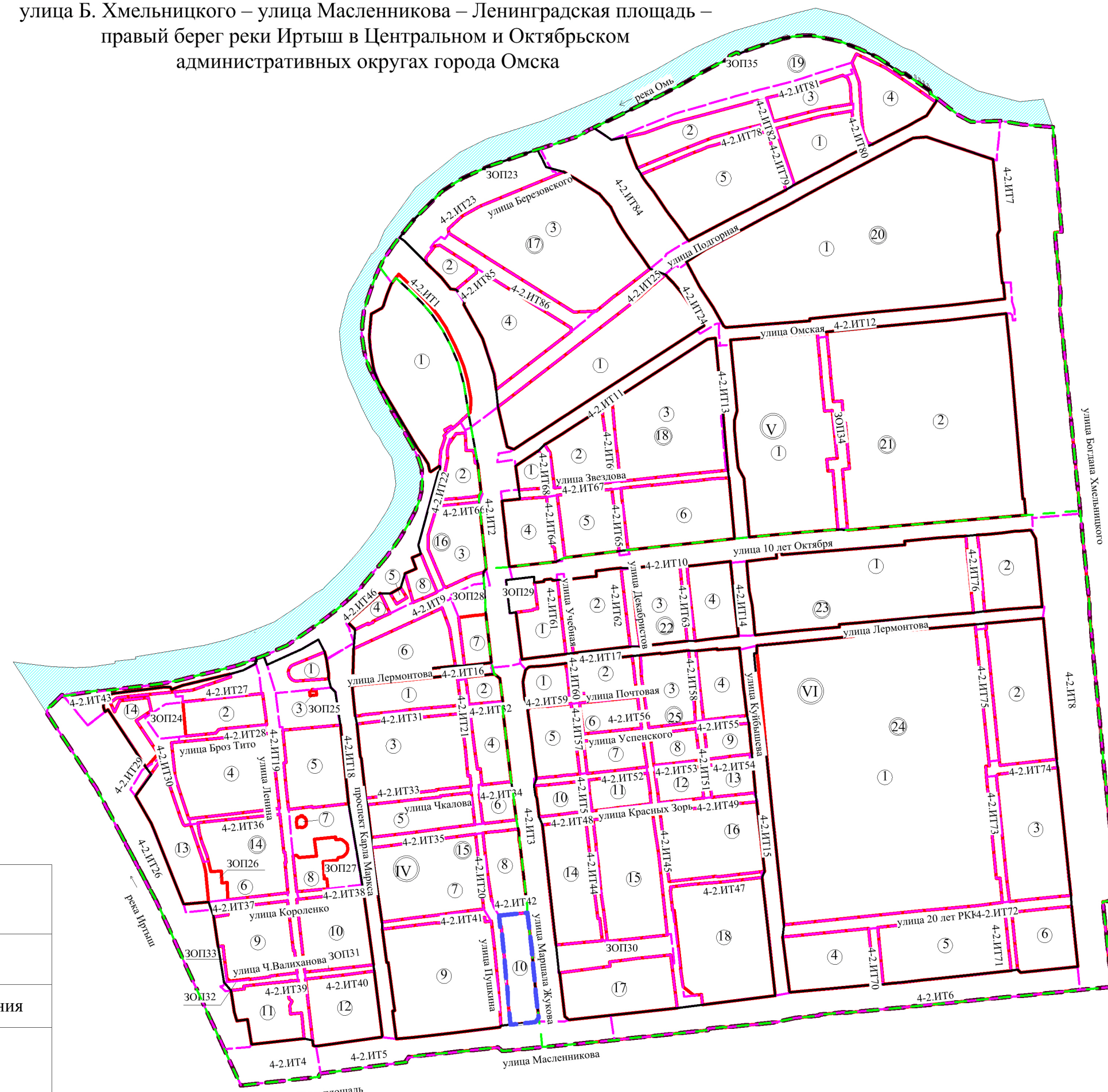
Схема расположения границ проектирования и элементов планировочной структуры проекта планировки территории, расположенной в границах: левый берег реки Оми – улица Б. Хмельницкого – улица Масленникова – Ленинградская площадь – правый берег реки Иртыш в Центральном и Октябрьском административных округах города Омска