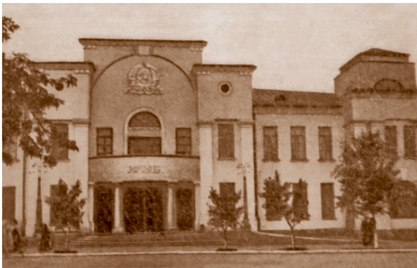
Клуб железнодорожников им. З. И. Лобкова (ул. Лобкова, 3). Построен в 1927 г. по проекту архитектора С. М. Игнатовича на месте здания Железнодорожного собрания

Большое значение для формирования новых эстетических вкусов в эти годы имела театральная самодеятельность. Успехом пользовались спектакли самодеятельного театрального коллектива клуба железнодорожников им. З. И. Лобкова.