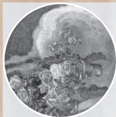
М. А. Врубель. Желтые розы. 1894. Холст, масло. 134,5 x 135,5 (круг)