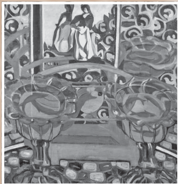
С. И. Дымшиц-Толстая. Натюрморт с зеркалом. 1911. Холст, масло. 96,5 x 101