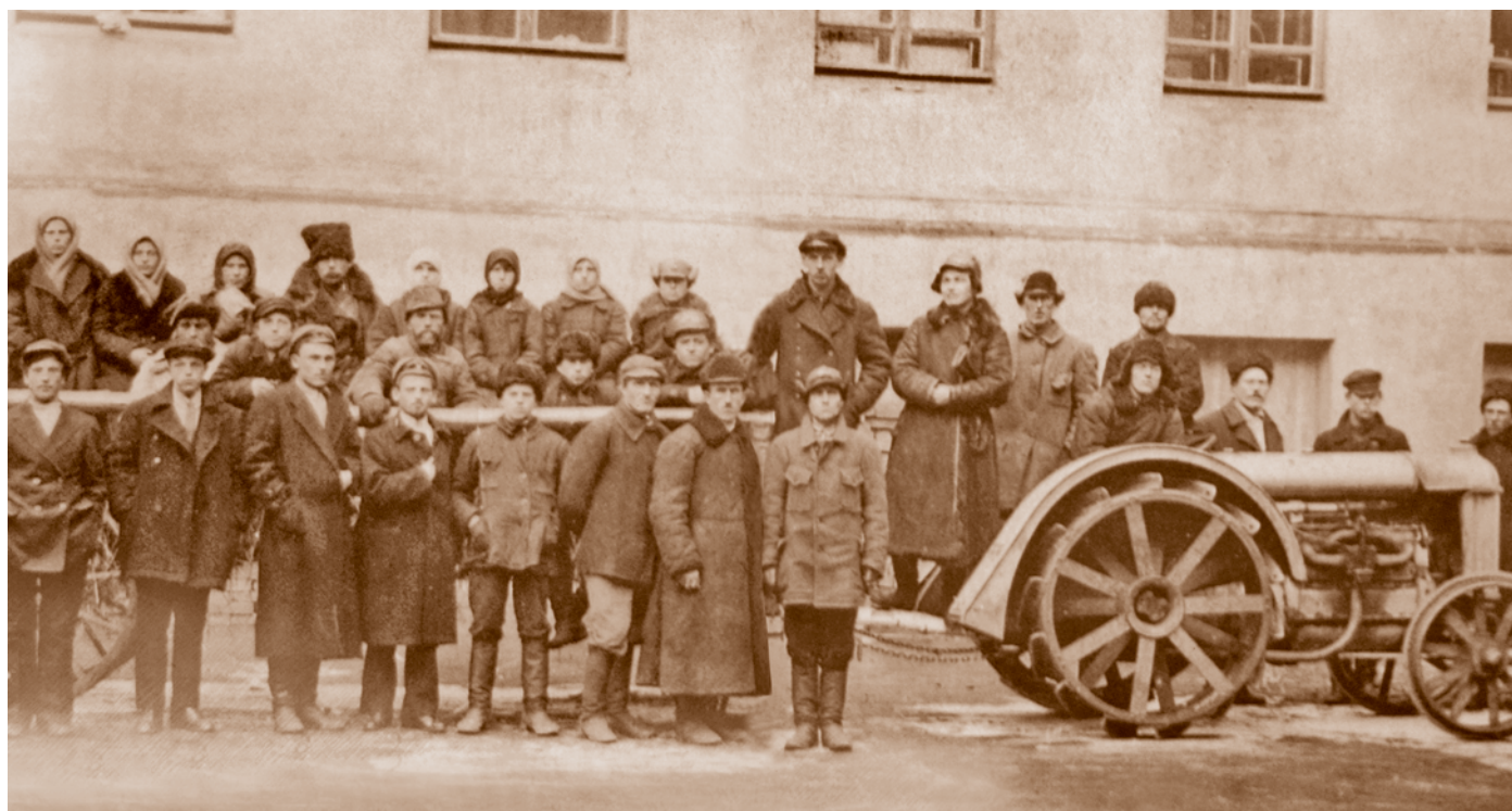
Сельскохозяйственная выставка Омского округа 1926 г. под эгидой Сибирского института сельского хозяйства и лесоводства.

Большую роль в деле ликвидации неграмотности сыграли школы малограмотных и ликвидационные пункты. В Омске по состоянию на 1 апреля 1924 г. первых было 40, вторых – 20. В их число входило три школы национальных меньшинств со 108 обучавшимися. Новая политическая власть не только провозгласила принцип всеобщности и доступности образования, но и прилагала значительные усилия по реализации этой установки, несмотря на значительные финансовые и экономические трудности.