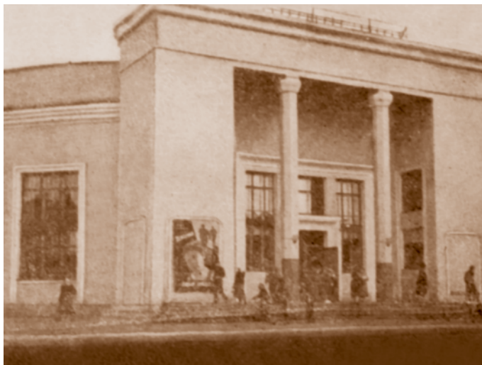
Кинотеатр «Октябрь». Из коллекции В. И. Селюка. Построен по проекту архитектора В. П. Калмыкова в 1939 г. (современный адрес – ул. Серова, 19а)

в развертывании социалистического соревнования и ударничества на производстве. Стало уделяться больше внимания организации клубных производственных кружков.