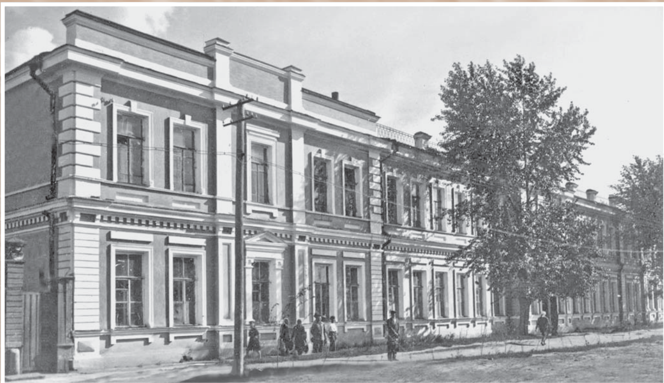
Здание Омского государственного педагогического института на ул. Интернациональной. Фотография 1930-х гг. Архитектор Н. Е. Вараксин. Построено в 1902 г. для Контрольной палаты. В 1922 г. здесь располагалась Омская губернская рабоче-крестьянская инспекция, в 1930-м – школа им. Парижской коммуны, в 1932-м – сельскохозяйственный техникум, с 1933 г. – пединститут. В 1982 г. надстроен третий этаж. Сейчас в этом здании идут занятия двух факультетов педагогического университета (ОмГПУ)