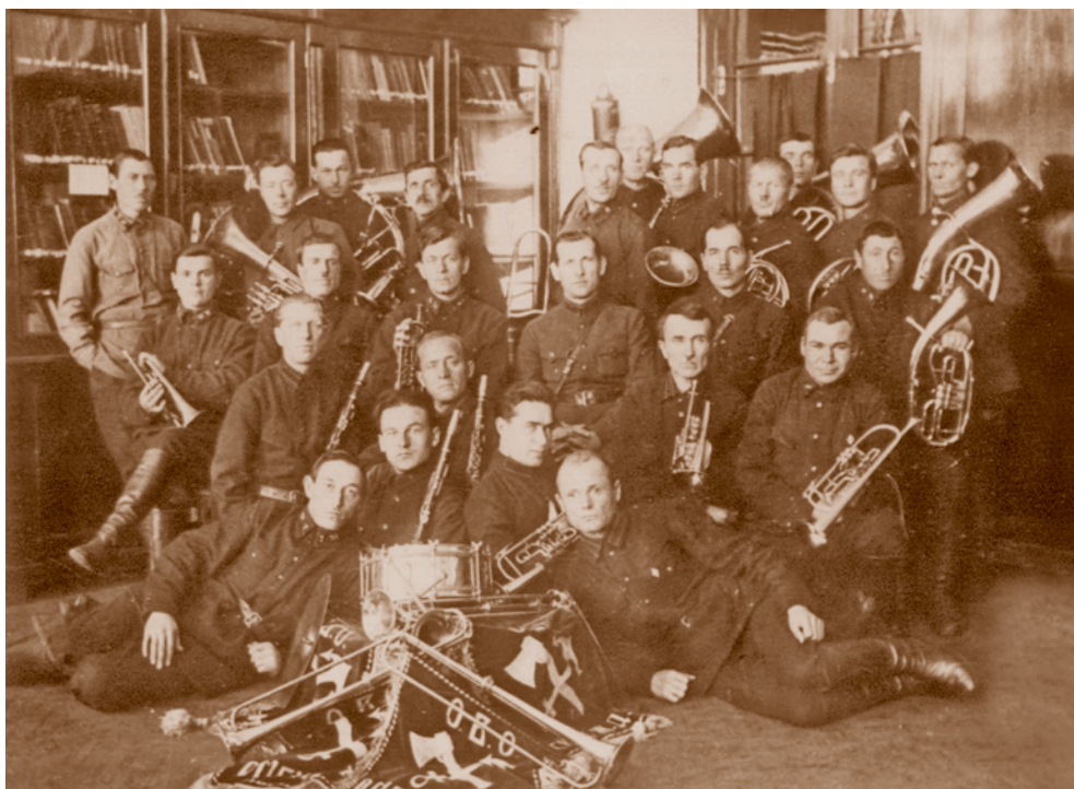
Оркестр военизированной стрелковой охраны Омской железнодорожной. 1931.

«В сохранившемся архивном фонде Общества омских краеведов есть свидетельство о создании в 1936 г. «фольклорной бригады»; в ее составе упоминается Леонид Мартынов. Он вернулся в Омск в 1932 г. из Вологды, куда был