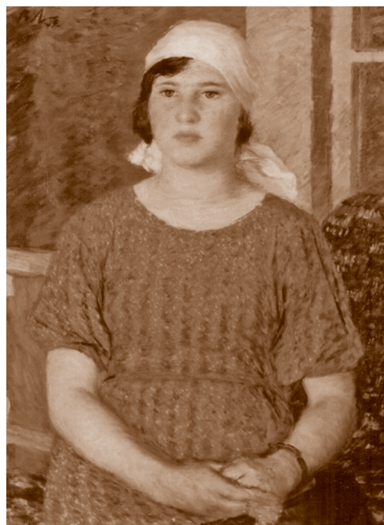
В. В. Лебедев. Рабфаковка с портфелем. 1937.

В 1922 г. для подготовки специалистов водного транспорта в городе уже имелись профтехшколы и школа заводского ученичества, вечерние курсы масленщиков и кочегаров. В этом же году Омгубпрофобр (подотдел при Омском губернском отделе народного образования) издал положение о школах фабрично-заводского ученичества – ФЗУ. Учитывая, что большинство учащейся молодежи в этих школах имело один-два класса общего образования, в учебные планы включали значительное количество часов по общему образованию. С 1923 г. началась активная работа по укреплению материально-технической базы ФЗУ. Так, учащиеся ФЗУ металлистов, проходя вечером теоретическое