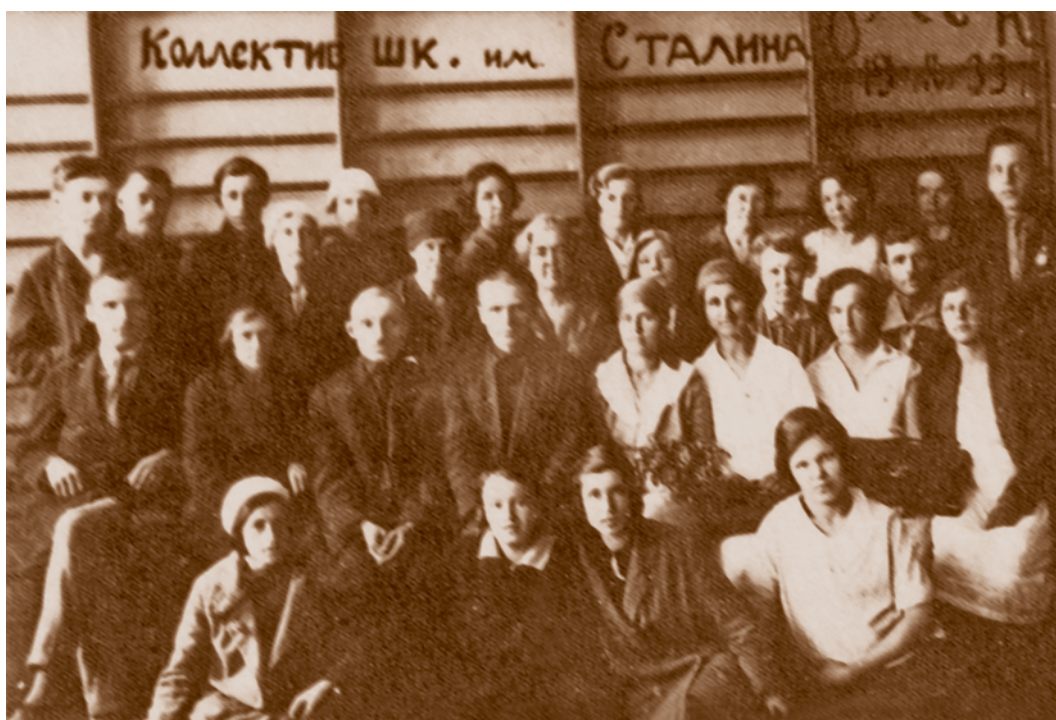
Педагогический коллектив школы им. И. В. Сталина (ул. Почтовая, 38). 1935.

10 октября 1932 г. в составе литературного, физико-математического и биологического факультетов начал