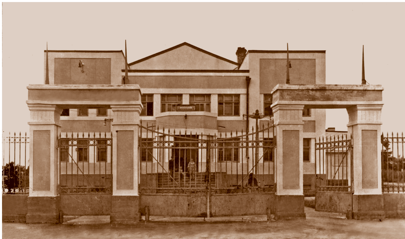
Клуб металлистов (ул. Вавилова, 45). Архитектор П. И. Русинов.

«В 1930 г. клуб металлистов был реорганизован в первый в Сибири Дом производственного просвещения. Наряду с обычной клубной художественной работой, в нем действовали дневные и вечерние курсы по повышению квалификации и подготовке кадров рабочих Сибсельмаша. В содержание работы всех клубов были включены вопросы выполнения промфинплана и организация помощи