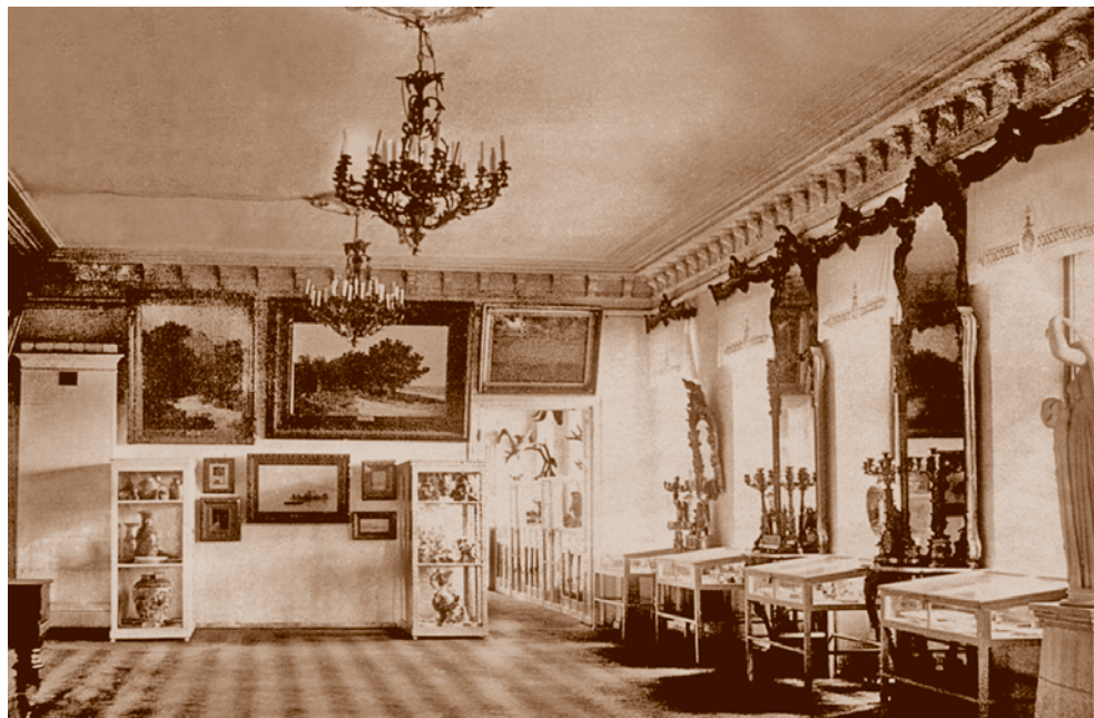
Интерьер картинной галереи Западно-Сибирского краевого музея. 1920-е. Из книги «Омский областной музей изобразительных искусств имени М. А. Врубеля» (Омск, 2004)

интернационал молодежи) проводились антирелигиозные диспуты. Применялись и другие формы борьбы. Приказом губисполкома № 77 от 3 января 1925 г. было отменено празднование Благовещения. В ночь с 14 на 15 апреля 1928 г. горком комсомола провел антипасхальное факельное шествие, а в музее была развернута антирелигиозная выставка.