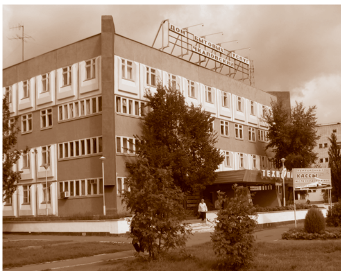
Дом быта «Чкаловский». Фотография 2008 г. из фондов МИСО

исчерпан, и требовалось принять насчет них какое-нибудь решение. Однако из-за кризисных явлений темпы строительства стали падать. Но все же в 1990 г., имея старый запас, удалось построить более 600 тыс. кв. м жилья.