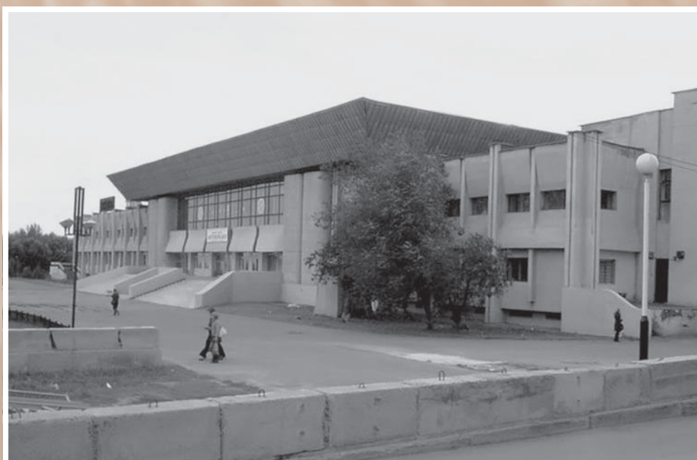
Здание нового автовокзала. В мае 1985 г. автовокзал переехал с проспекта Маркса на Левобережье