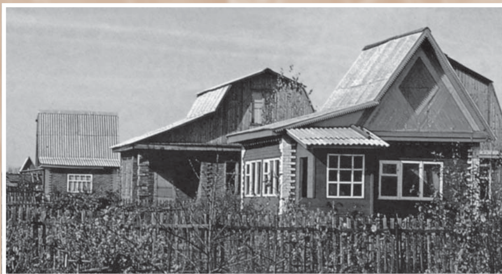
В садоводческом товариществе. В 1988 г. в Омске было организовано 286 садоводческих товариществ