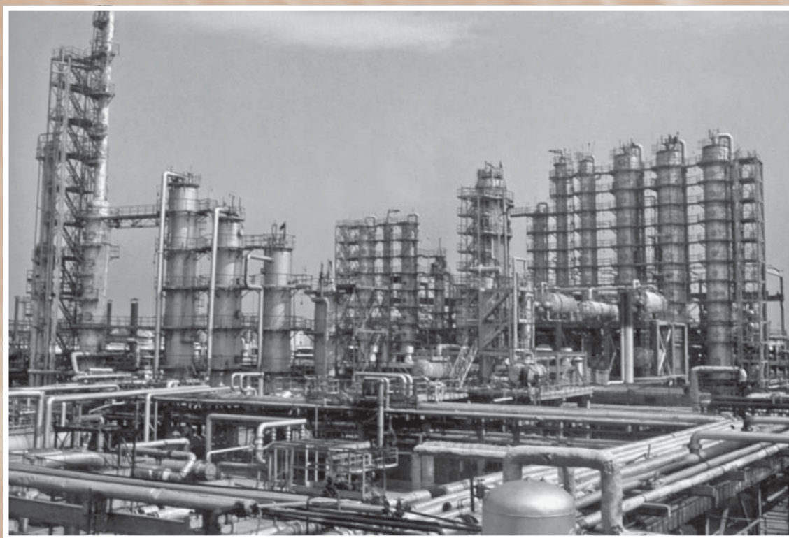
Производственное объединение «Омскнефтеоргсинтез». Вид установки.