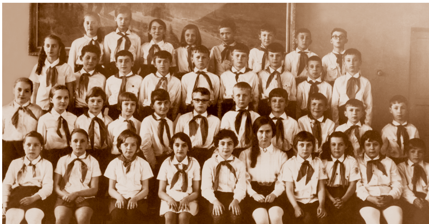
Как 37 разделить на 4? Четвертый класс средней школы № 69.

В 1980-е гг. серьезные изменения произошли в системе профтехобразования (ПТО). Партийные, государствен-