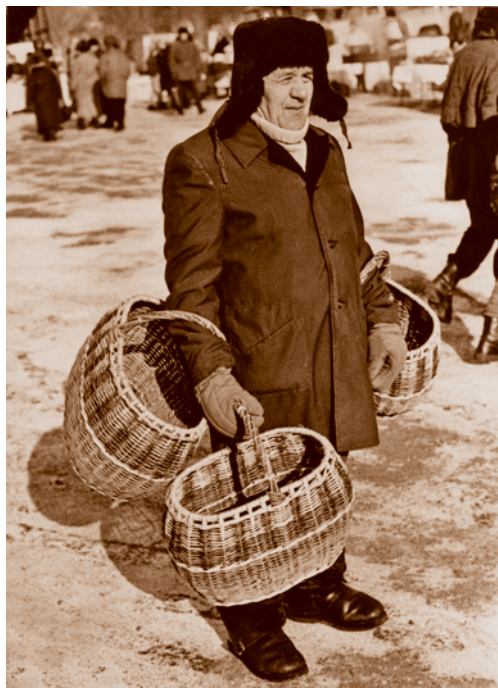
«Кому корзины?»

Из записки «Об итогах развития народного хозяйства Омской области в первом полугодии 1985 г.»: «...план по реализации не выполнен, с ним не справились 65 пред-