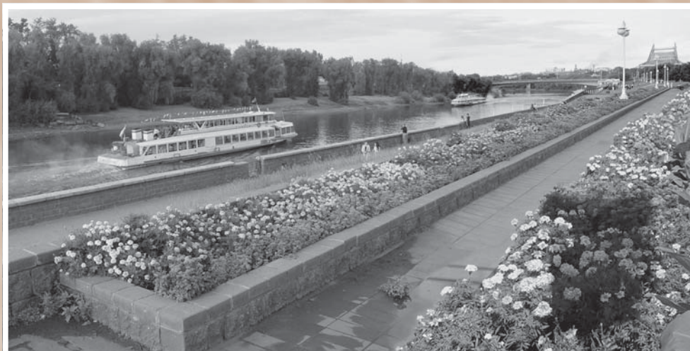
Летний Омск. На рубеже 1980–1990-х гг. в городе ежегодно высаживалось около 25 млн цветов.