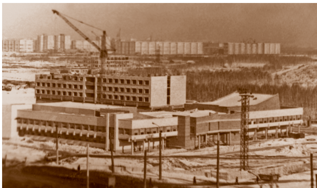
На строительстве Дворца молодежи на Левобережье.

В 1986 г. на жилищное строительство было израсходовано на 16 млн руб. больше, чем в 1985 г. (181 млн руб.). Было построено 548 тыс. кв. м нового жилья, 33 тыс. омичей улучшили свои жилищные условия. Жилищный фонд города увеличился до 16,3 млн кв. м. В 1987 г. было построено домов общей площадью более 650 тыс. кв. м, улучшили жилищные условия около 37 тыс. жителей. В 1988 г. ввели в строй более 730 тыс. кв. м жилья. Но в городе было около 500 тыс. кв. м жилых домов 335-й серии («хрущевки»), построенных более 25 лет назад, срок их эксплуатации был