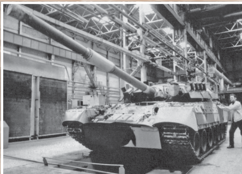
Танк Т-80У Омского завода транспортного машиностроения им. Октябрьской революции.

В июне 1990 г. было принято решение о возвращении производственного объединения «Полет» в рамках конверсии к производству авиационной техники, а в декабре этого года на «Полет» пришла первая партия конструкторской документации на Ан-74