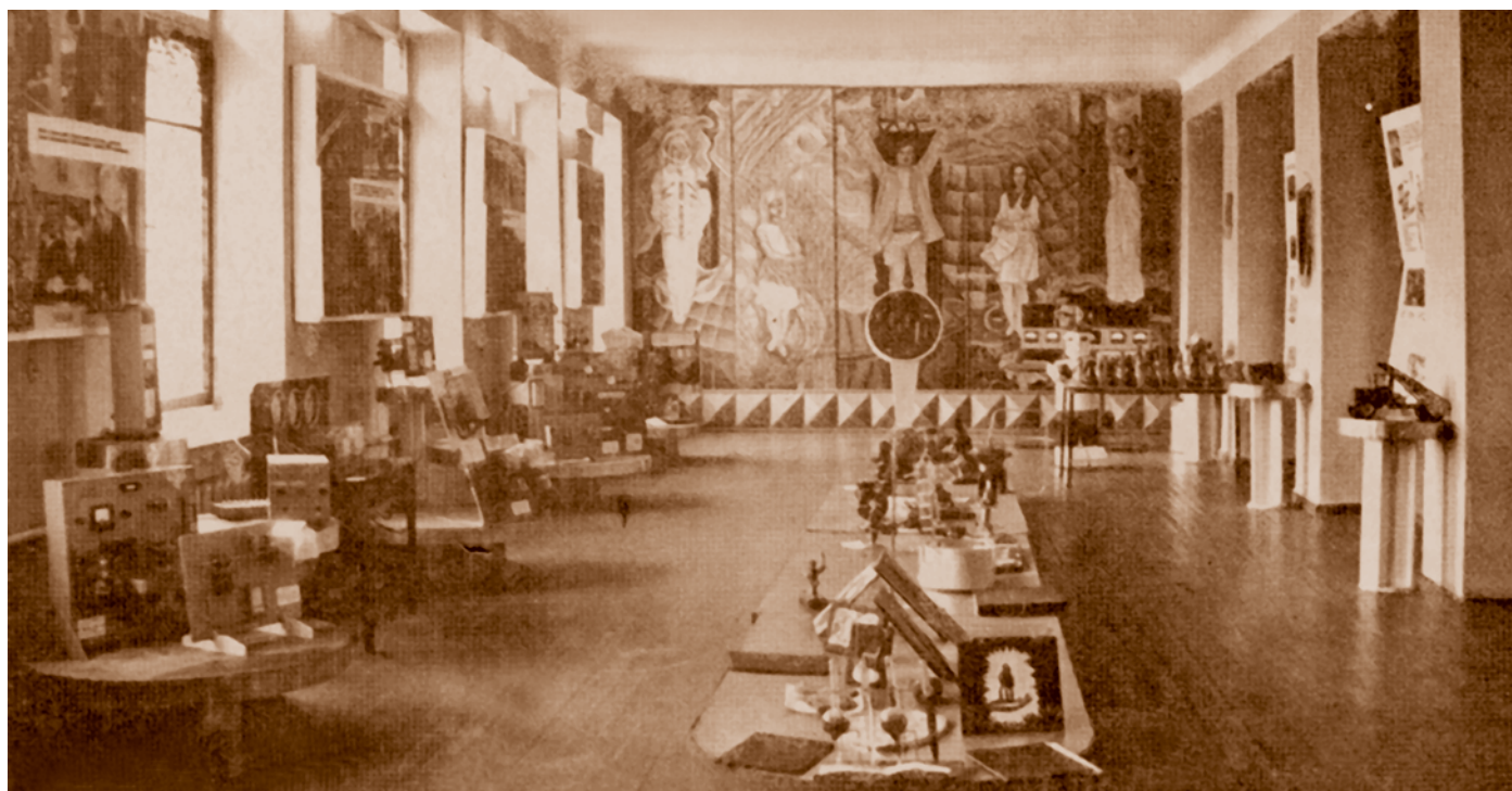
Выставка технического творчества учащихся и работников технического училища № 56*. Училище открылось в 1966 г. как базовое учебное заведение Омского нефтехимического комбината. С 1989 г. – профессиональный нефтехимический лицей

Число техникумов в Омске за годы перестройки не изменилось, а количество учащихся в них даже несколько сократилось – с 32,3 тыс. до 29,9 тыс. чел. Однако учащиеся техникумов активно принимали участие в различных выставках. В 1985 г. по итогам зональной выставки научно-технического творчества, проходившей в Новосибирске, экспонат Омского индустриально-педагогического техникума, стенд для лабораторных работ, был рекомендован на республиканский тур второго Всесоюзного конкурса на лучшую экспериментально-конструкторскую, опытническую и творческую работу учащихся средних специальных учебных заведений. В 1987 г. радиоуправляемый макет козлового крана, изготовленный студентами этого же