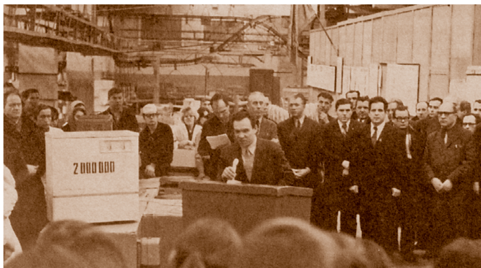
Праздник по случаю выпуска юбилейной стиральной машины на ПО «Полет»*