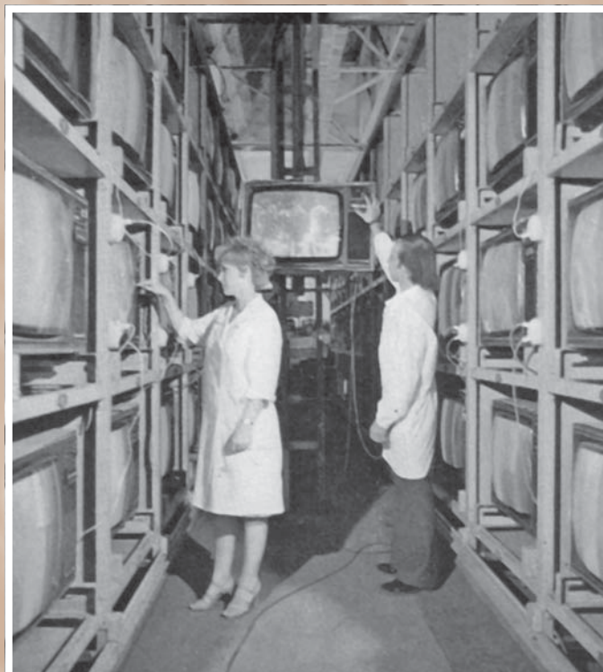
На Омском телевизионном заводе. Из фондов МИСО