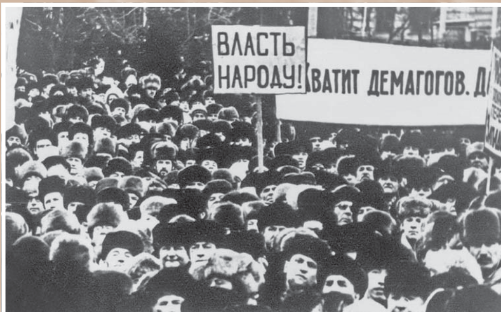
Предвыборный митинг на центральной площади города. 25 февраля 1990 г.