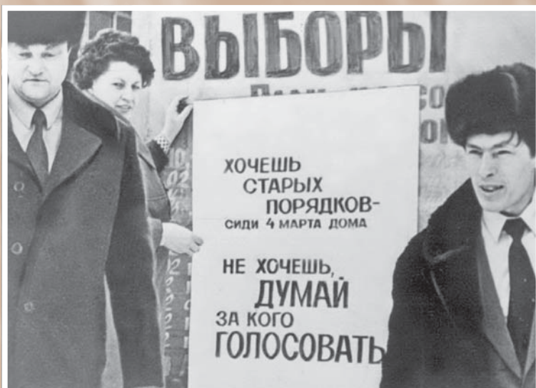
В агитпункте избирательного участка № 207 на выборах в Верховный Совет РСФСР. Фрагмент наглядной агитации. 4 марта 1990 г.