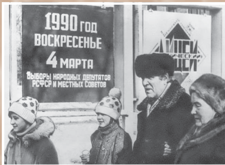
Избиратели у входа в агитпункт избирательного участка № 4 Советского района перед голосо- ванием на выборах в Верховный Совет РСФСР и местные Советы. 4 марта 1990 г.