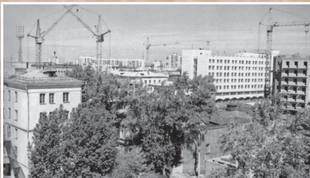
Обновление жилого фонда в Центральном районе. 1970-е гг.