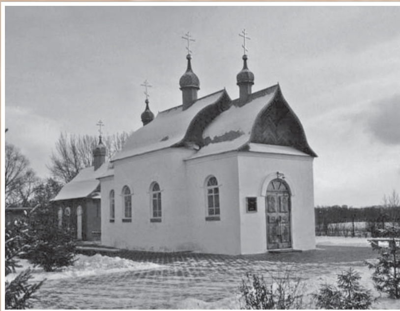
Церковь Всех Святых в земле Сибирской просиявших (ул. Народная, 17). 1989. Первый новый храм, возведенный в Омске к торжествам в честь тысячелетия крещения Руси.