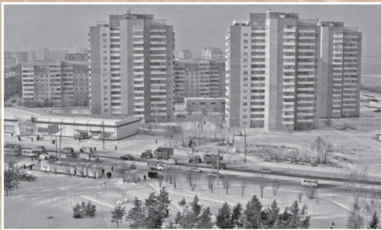
Проект Комарова на Левобережье. 1980-е. Из фондов МИСО. В 1980-е гг. Кировский район был одной из главных строительных площадок города