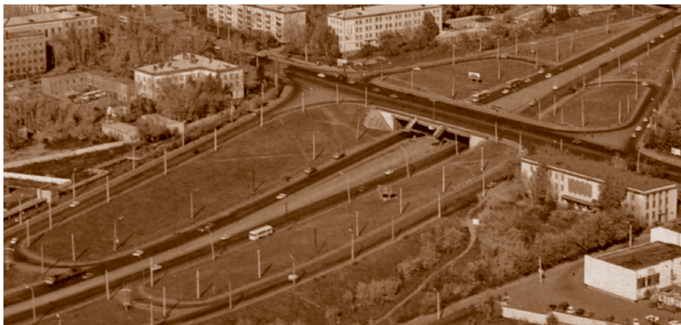
Вид Омска сверху: автомобильная развязка около телецентра. Фотография 1978 г.

Для оперативного управления деятельностью городского Совета был избран президиум из 18 депутатов. Президиум (в дальнейшем Малый совет) рассматривал текущие вопросы между сессиями в рамках своей компетенции. Совет имел самостоятельный бюджет, штатных специалистов, консультантов и технический персонал. Изначально функции исполнительного комитета городского Совета 1990 г. были аналогичны функциям горисполкома предыдущего созыва. Но после принятия Закона Российской Федерации «О приватизации государственных и муниципальных предприятий в РФ» от 3 июля 1991 г. функции местных Советов и их исполкомов существенно меняются, так как процессы разгосударствления и приватизации предприятий торговли, бытового обслуживания, общественного питания и других отраслей привели к ликвидации ряда областных и городских управлений, созданию множества обществ с ограниченной ответственностью, открытых и закрытых обществ, частных предприятий и потере по отношению к их деятельности со стороны органов местного самоуправления не только управляющих и регулирующих, но по существу и контрольных функций.