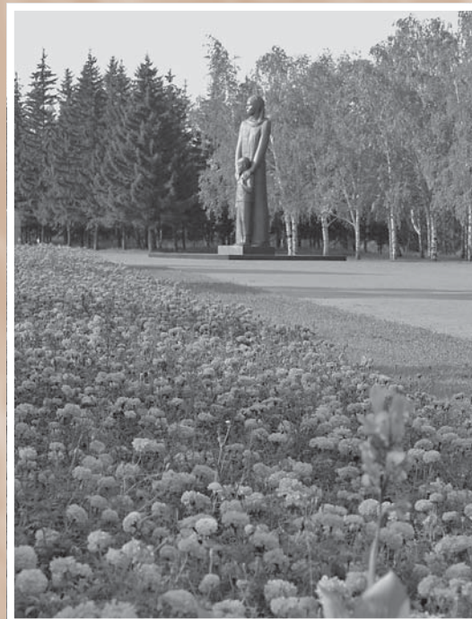
Скульптура Матери с сыном в Парке культуры и отдыха им. 30-летия Победы. Мемориальный комплекс открыт 9 мая 1975 г. Скульптор Д. Б. Рябичев, архитектор Н. А. Ковальчук