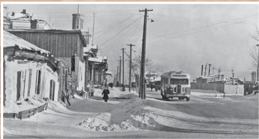
Ленинградская площадь до реконструкции 1959 г.