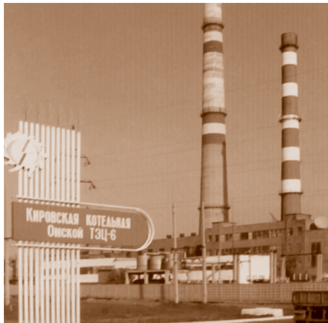
Кировская районная котельная – основной источник централизованного теплоснабжения Левобережья (ул. 2-я Солнечная, 52).

В 1999 г. на балансе предприятия было уже более 900 км тепловых сетей в двухтрубном исчислении, 42 котельных общей установленной мощностью 1 731 Гкал/час, 45 цен-