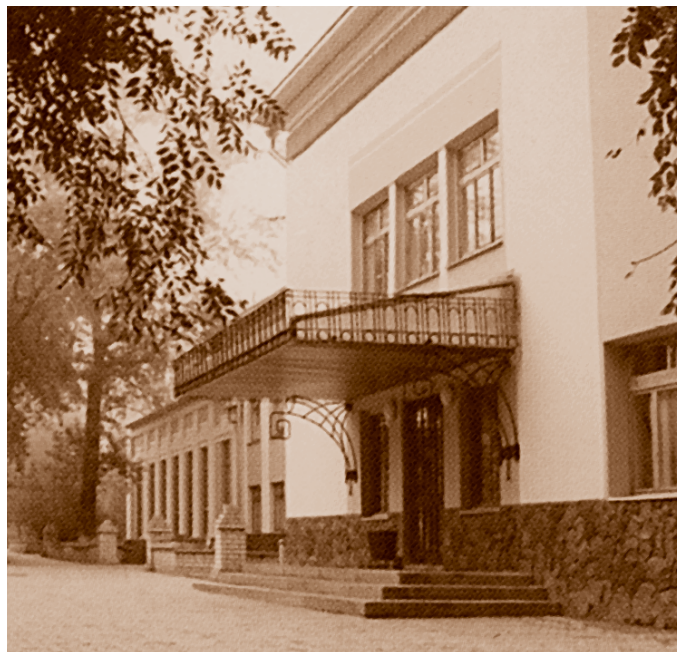
Здание ОАО «ОмскВодоканал» (ул. Маяковского, 2)*

К 1970–1973 гг. было закончено строительство комплекса очистных сооружений. С 1974-го по 1980 г. введены в эксплуатацию очистные сооружения канализации завода «Синтетический каучук» с механической очисткой, где фактически очищались стоки со всего города. В 1978 г.