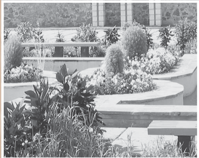
Фантазии флористов: современные тенденции оформления городских территорий.

Согласно постановлению, расширены функции департамента городского хозяйства в сфере управления