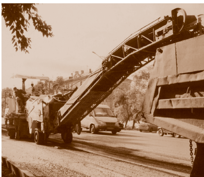
Работы по реконструкции автомобильной дороги по ул. 10 лет Октября. 2008*

Муниципальное предприятие «Комбинат специальных услуг» образовалось в результате ряда реорганизаций 1987, 1994, 1997, 1998 и 2007 гг. В его составе функционируют ритуальная служба (девять магазинов-салонов, организаторы ритуала), 10 действующих кладбищ площадью 455 гектаров, транспортный, столярный, бетонный, цветочный цех и цех металлоизделий. По итогам работы за 1997, 1998, 2001, 2002, 2004, 2006, 2008 гг. предприятие занимало первое-третье места во всероссийских конкурсах за активную работу в новых экономических условиях и награждалось дипломами высшей, первой и второй степени, а в 2002 г. получило гран-при «Золотой ключ».