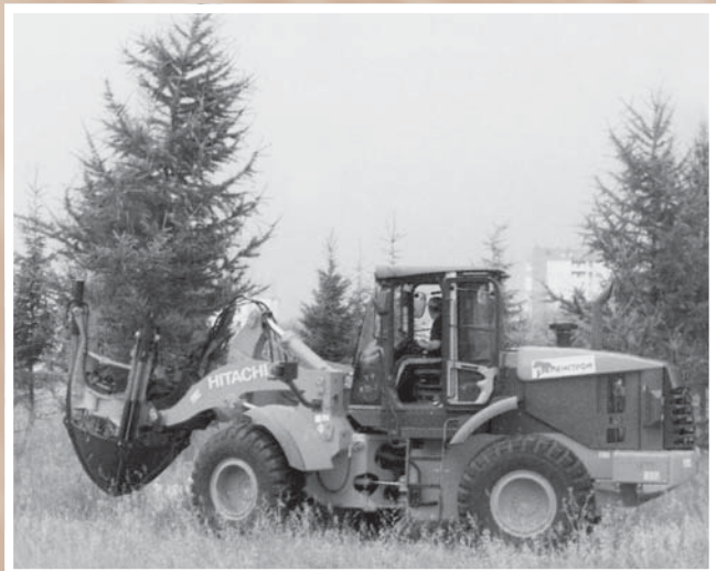
Высадка крупномерных деревьев с применением специализированной техники*