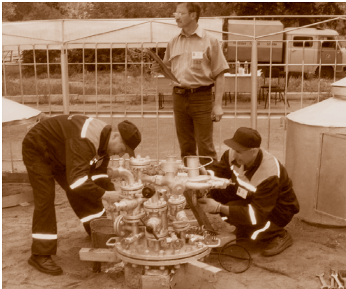
Проверка технического состояния газового оборудования газораспределительной станции специалистами отдела капитального строительства ОАО «Омскгоргаз»*

организация газового хозяйства города. Она обслуживает более 540 тыс. абонентов, пользующихся как природным, так и сжиженным газом (бутан-пропановой смесью). В ведении предприятия 300 км газопроводов высокого давления а также около тысячи газораспределительных установок. Оно обслуживает 240 тыс. квартир и почти 48 тыс. газобаллонных установок. Имеются службы, которые организуют работы по монтажу и перемонтажу газового оборудования у населения (монтажный участок), обеспечивают получение и реализацию газа (служба доставки). Ведется ремонт и реконструкция производственных баз наружных газопроводов, установок сжиженного углеводородного газа и других объектов газового хозяйства.