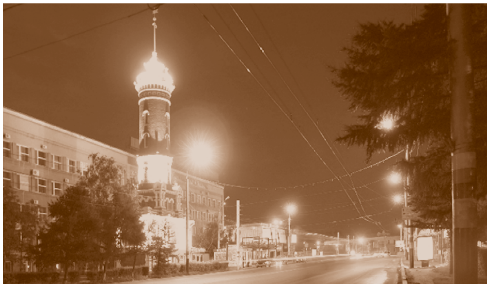
Программа «Светлый город» в действии: огни ночного Омска (ул. Интернациональная).

Здесь работает много заслуженных людей, в том числе кавалеры орденов и медалей СССР и Российской Федерации, почетные работники жилищно-коммунального хозяйства, заслуженные энергетики. В 1996 и 1999 гг. предприятие награждалось почетными грамотами Министерства строительства РФ и Государственного комитета по строительной, архитектурной и коммунальной политике,