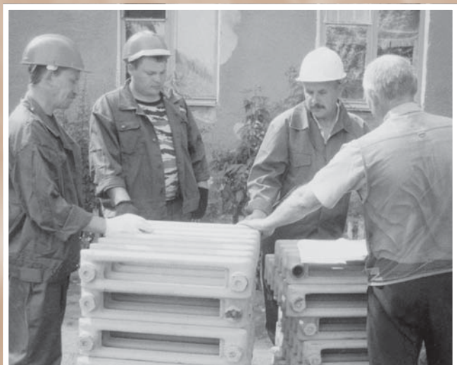
Замена отопительной системы в жилом доме*