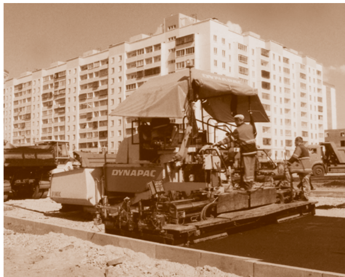
Укладка асфальта в новом жилом массиве города. 2008*

В 2009 г. начались работы по внедрению автоматизированной системы управления дорожным движением, предназначенной для оптимизации режимов светофорного регулирования.