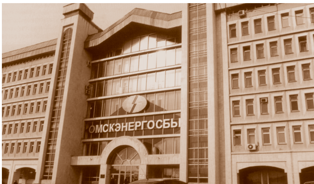
Новое здание ОАО «Омская энергосбытовая компания» (ул. Маршала Жукова, 74, корп. 2).

тральных тепловых пунктов установленной мощностью 594 Гкал/час и 11 тепловых перекачивающих насосных станций. Главным достижением 1990–2000 гг. можно считать газификацию котельных. В первой половине 1990-х гг. экологически чистое и более дешевое топливо прочно вошло в жизнь омичей. ПТСК не могло остаться в стороне. Начали с малого – в 1996 г. построили газопровод и подали газ в котельную по ул. 6-й Ленинградской. Теперь природный газ является основным видом топлива на предприятии. Из 24 котельных – 18 работают на природном газе. На газопроводах общей протяженностью более 5 км