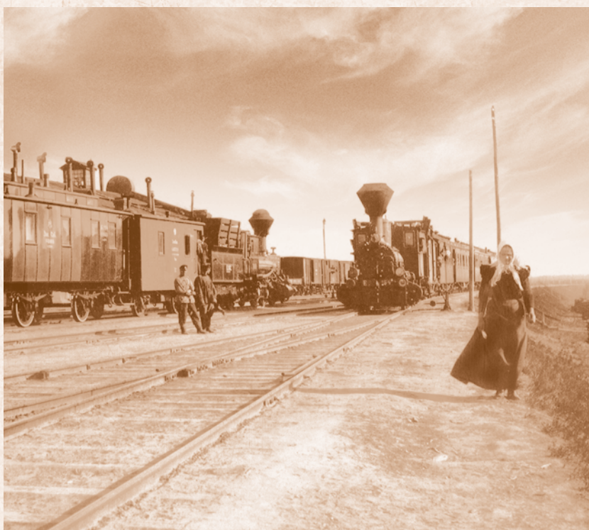
Прибытие поезда на станцию Омск. 1896