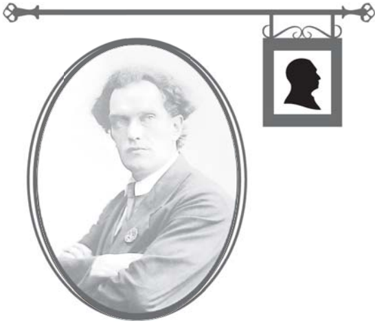
КУЙБЫШЕВ Валериан Владимирович (1888–1935)

Социал-демократ, государственный и партийный деятель. Учился в Сибирском кадетском корпусе. Член РСДРП с 1904 г., активно участвовал в деятельности омской социал-демократической организации. Был арестован. До 1907 г. находился в омской тюрьме, затем по приговору суда выслан из Омска. Вел революционную работу во многих городах России.