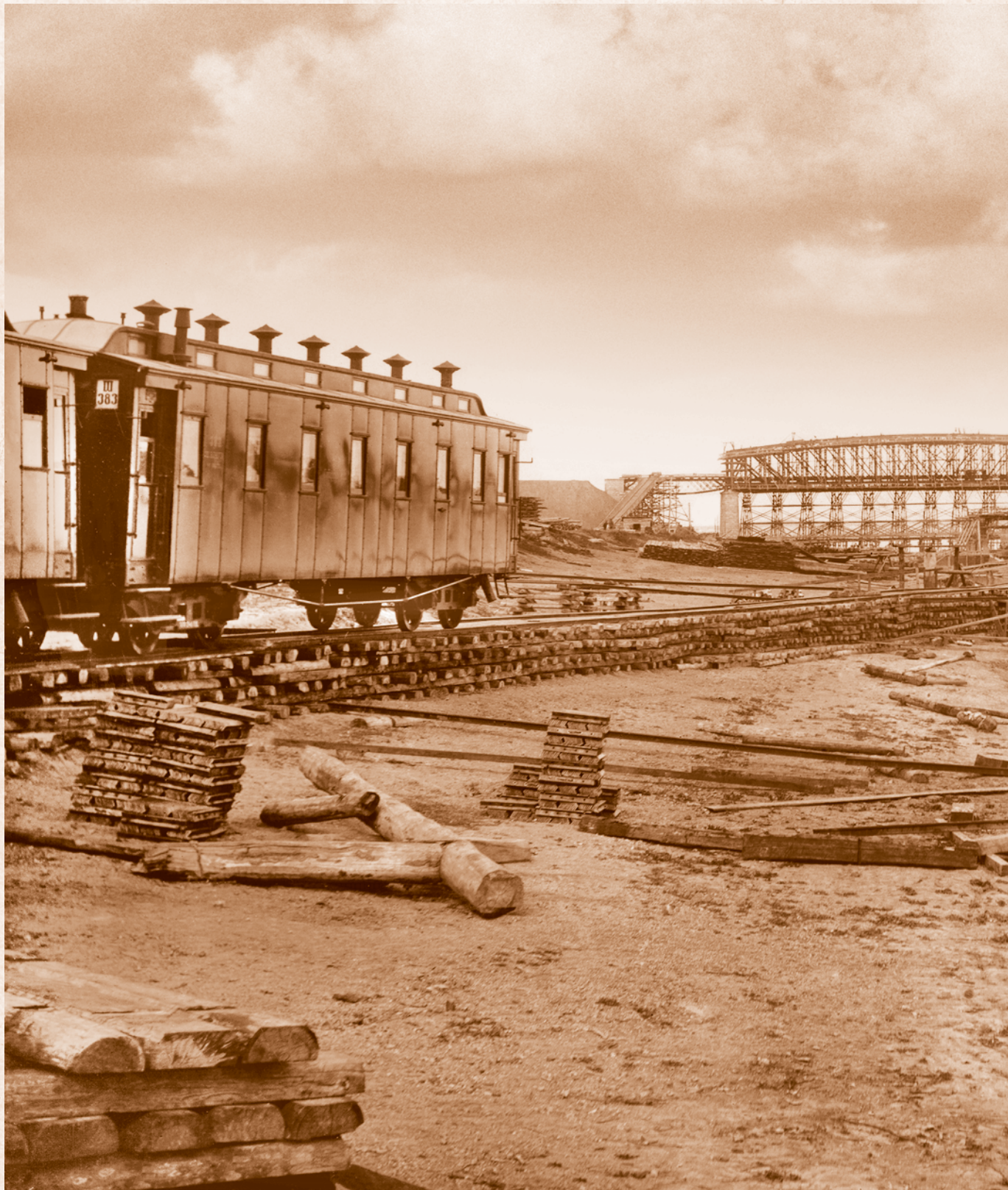
Строительство железнодорожного моста через р. Иртыш. 1895