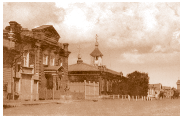
Ольгинский приют и городское училище на Александровском проспекте. Начало XX в.

Глебов Ю. Я., Павлов Г. А., Шевченко П. Л. Указ. соч. – С. 36.