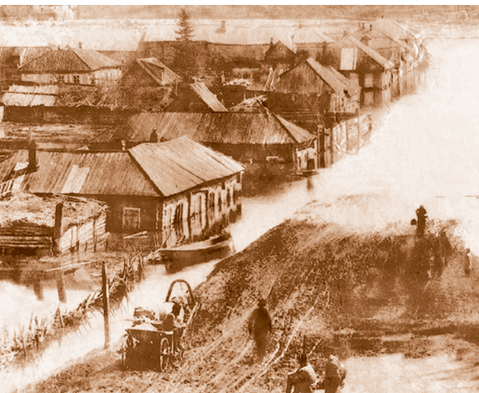
Наводнение в Мокринском форштадте. 1892