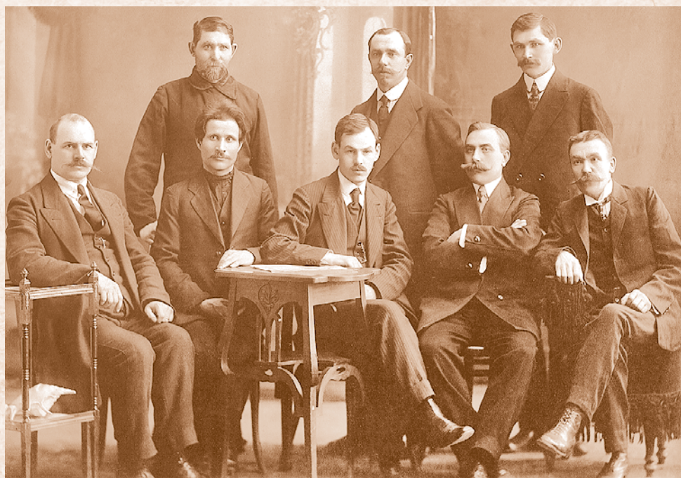
Первое организационное собрание правления Омского общества потребителей. Начало XX в.