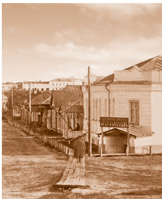
Ул. 2-й Взвоз Мокринского форштадта. 1880-е

Генерал-губернатор Степного края, командующий войсками Омского военного округа и войсковой наказной атаман Сибирского казачьего войска (1889–1900).