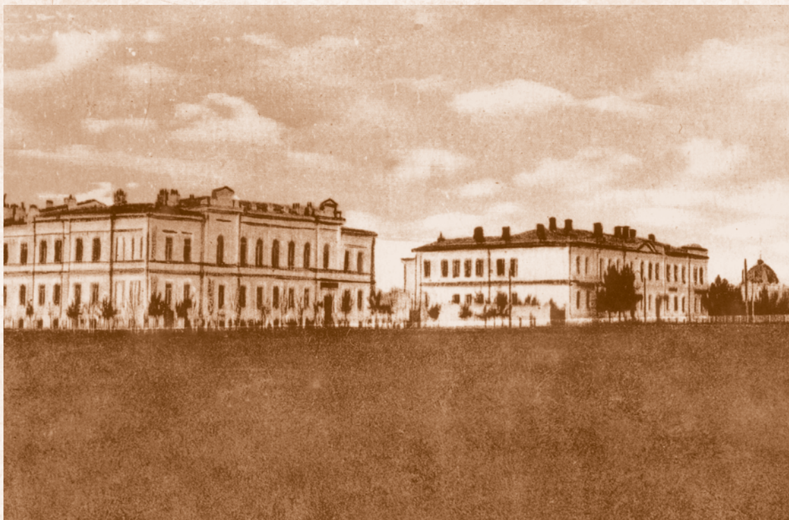
Отделение Государственного банка и Казенная палата. Начало XX в.