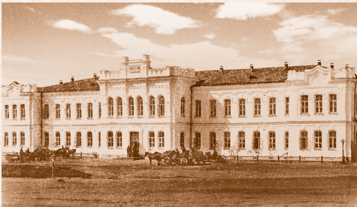
Первая женская гимназия. 1880-е