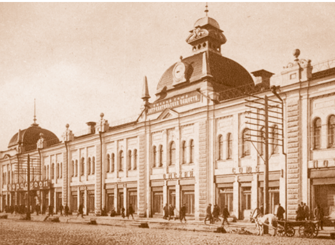
Омский союз потребительских обществ. 1920-е