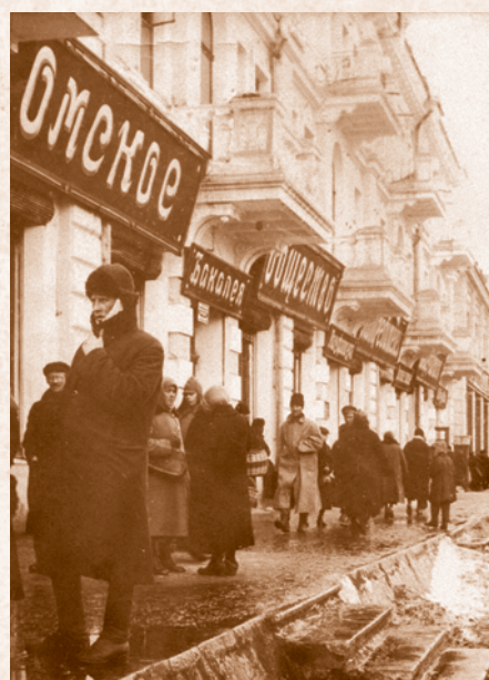
Универмаг ЦРК. 1926