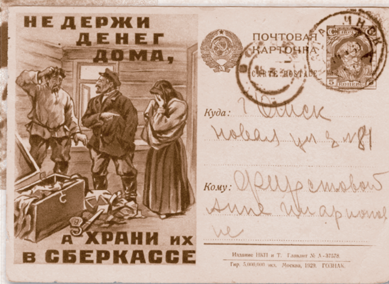
Почтовая карточка «Не держи денег дома, а храни их в Сберкассе» 18 . 1929