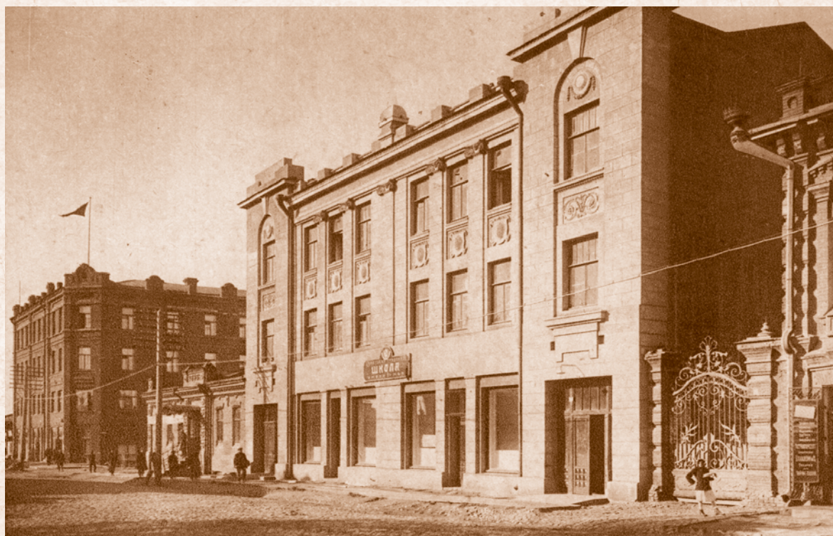
Школа имени 1-го Мая. 1930-е