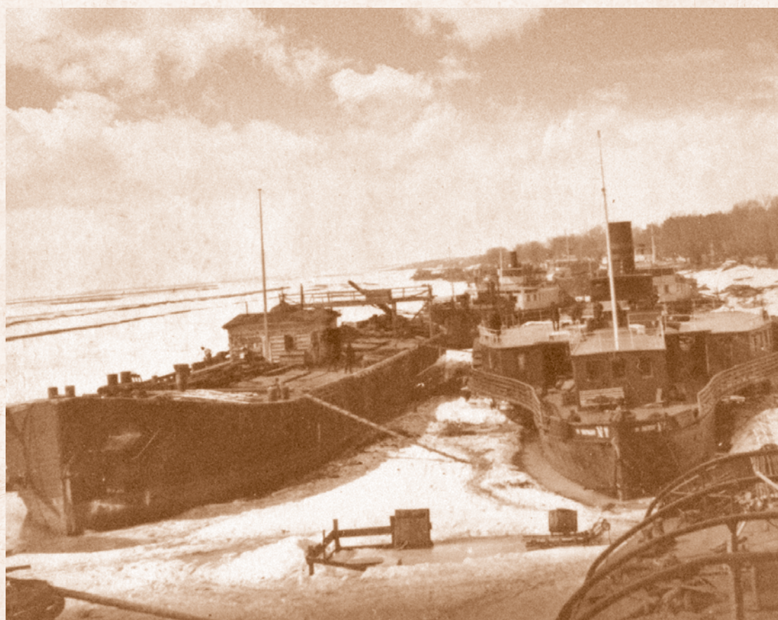
Омский порт. Стоянка судов. 1926