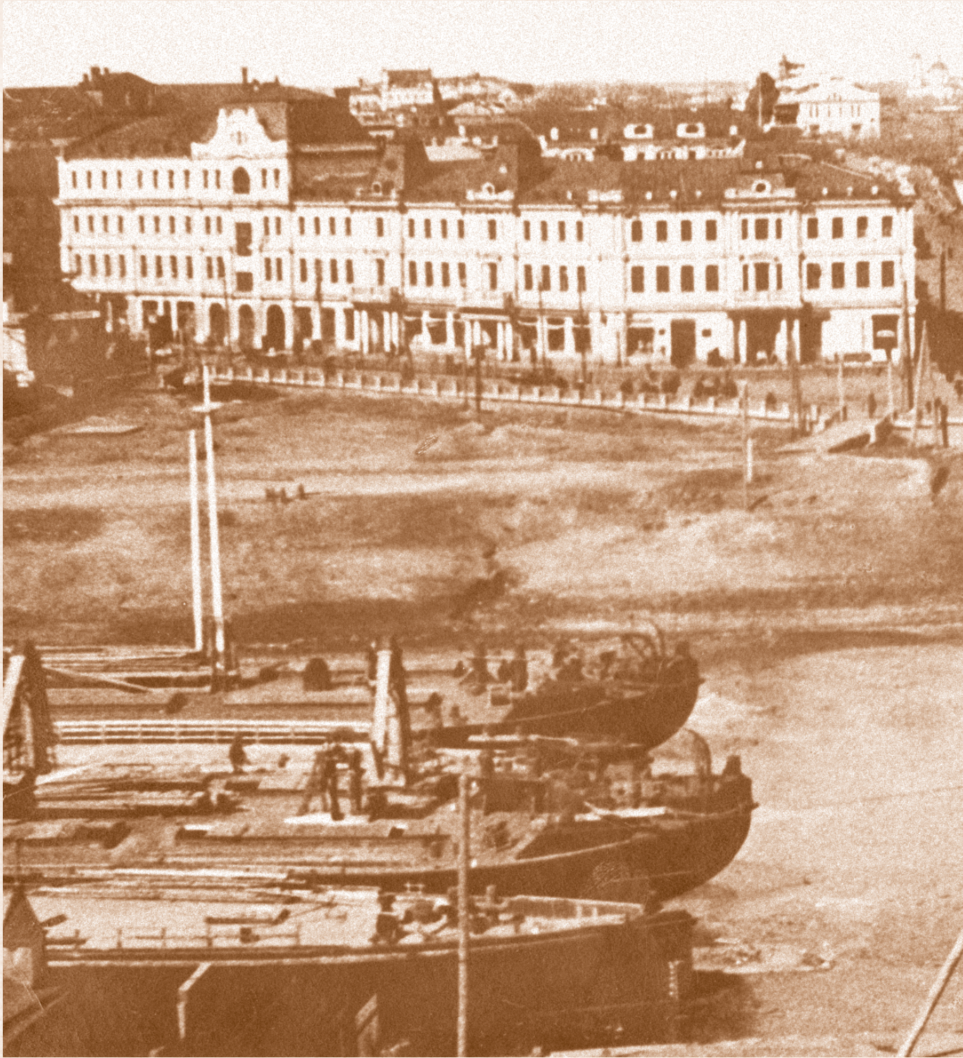
Ул. Ленина. 1930