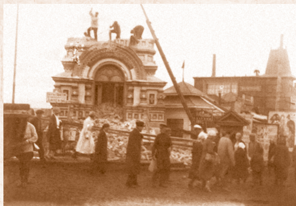
Разрушение Серафимо-Алексеевской часовни. 1927