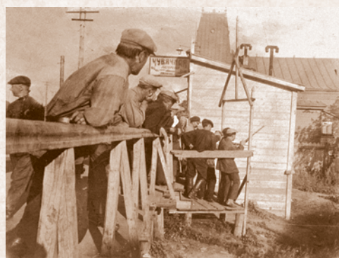
В уличном тире. 1930