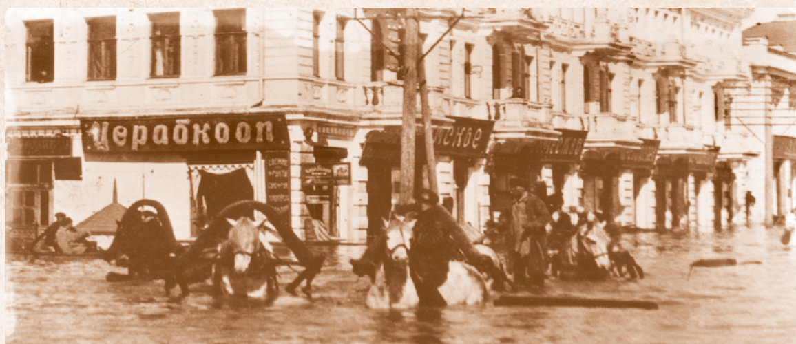
Наводнение в центре города. 1928