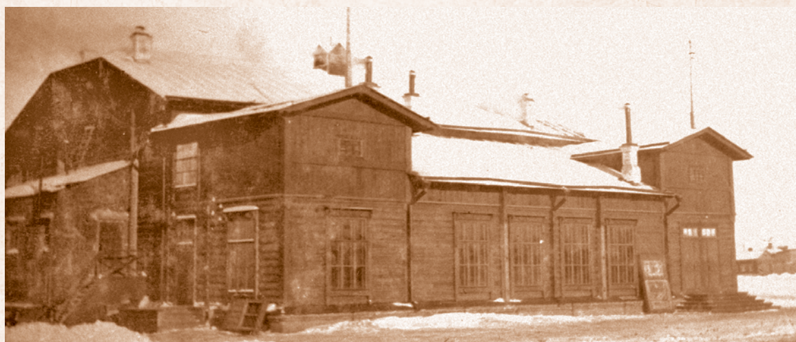
Кинотеатр «Маяк» на ул. Мясницкой 12 . 1927