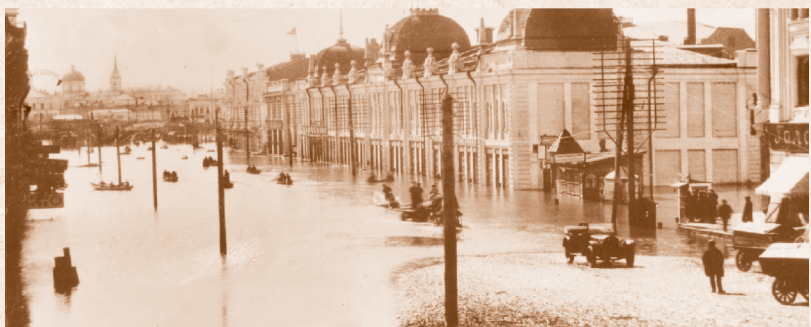
Наводнение на ул. Ленина. 1928