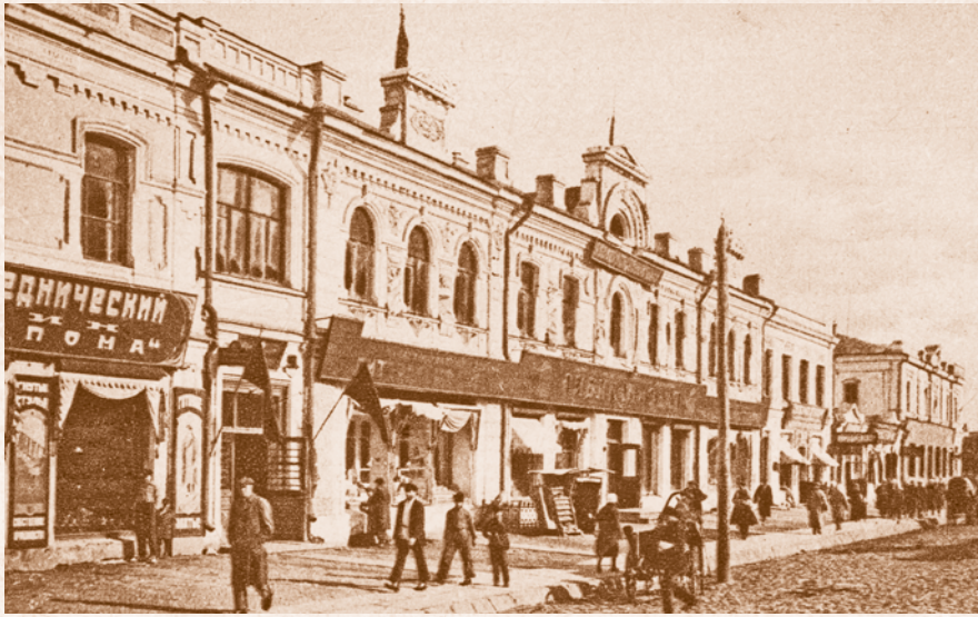
Ул. Ленина. Госбанк и Сибкрайиздат. 1920-е