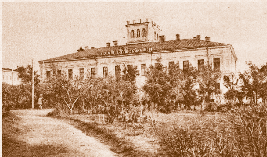
Западно-Сибирский краевой музей. 1920-е