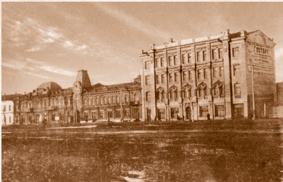
Почта, телеграф, госторг. 1929