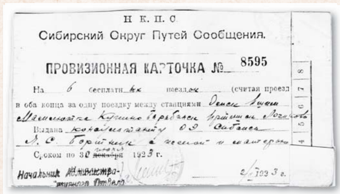
Документ, удостоверяющий право бесплатного проезда по железной дороге 18 . 1923