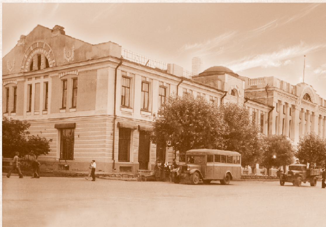
Автодорожный институт 12 . 1930