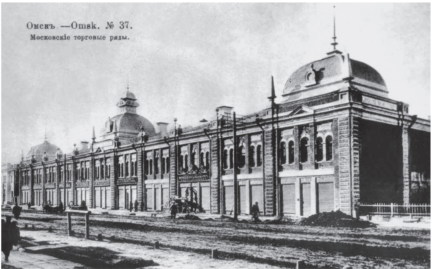
Московские торговые ряды (совр. ул. Ленина, 14). 1904.