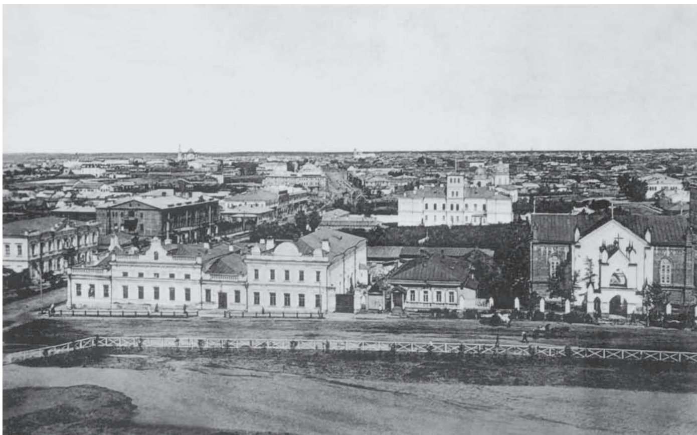
Панорама Омска. Начало XX века. Вид с колокольни Никольского казачьего собора на Общественное собрание и генерал-губернаторский дворец.