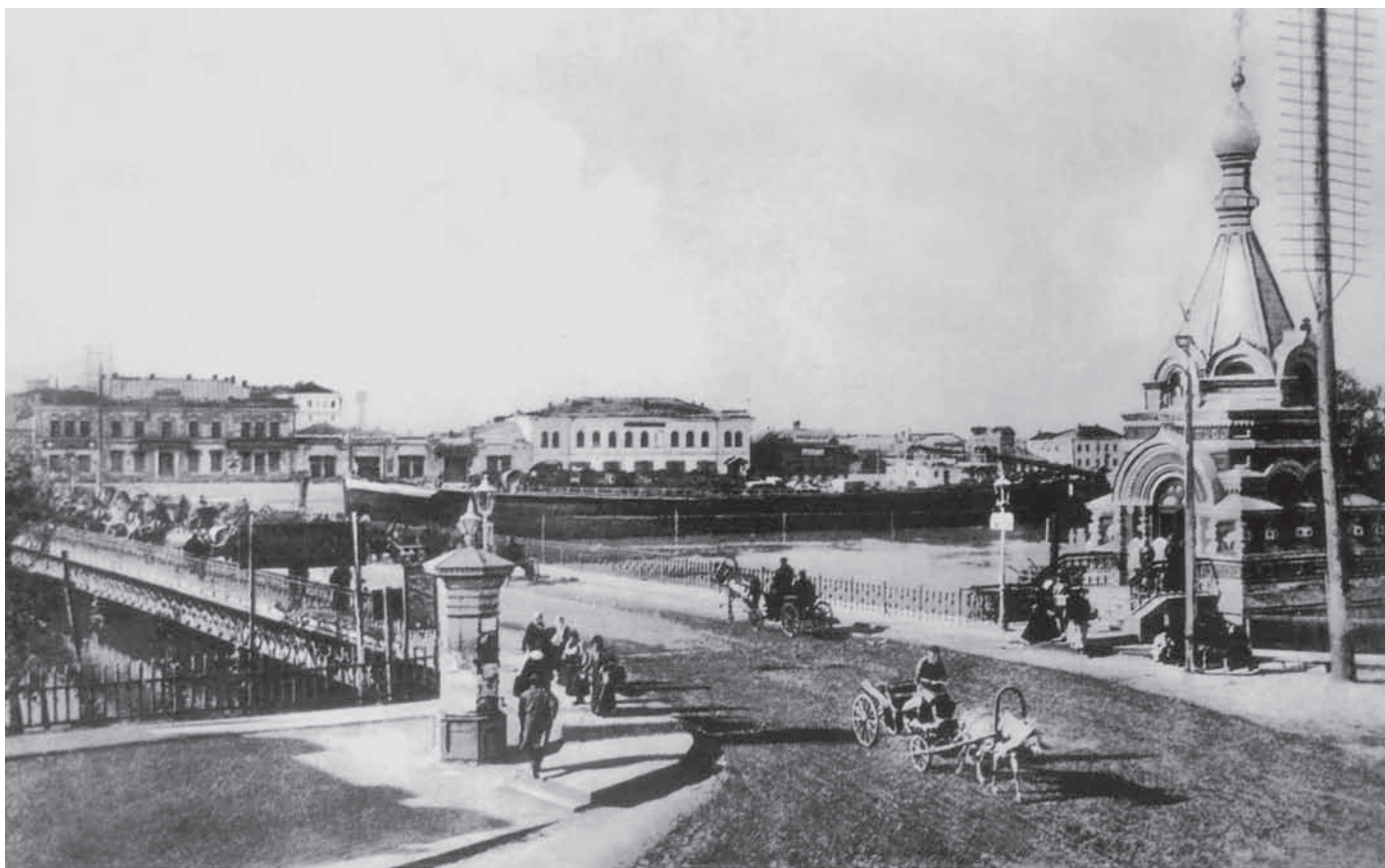
Железный мост через Омь. Начало XX века. Вид с Любинского проспекта на мост и левый берег Оми.