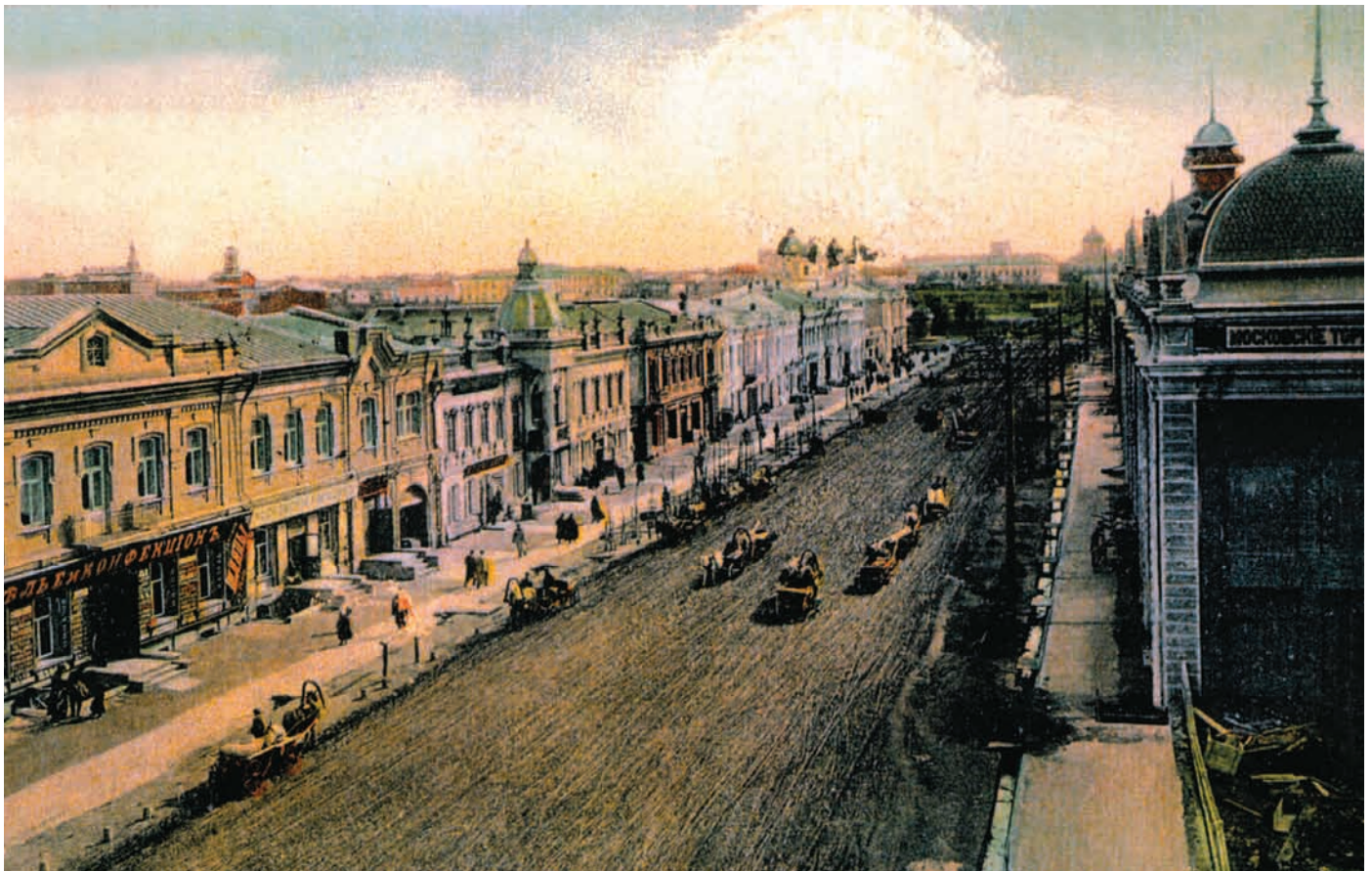
Любинский проспект. Почтовая открытка начала XX в.