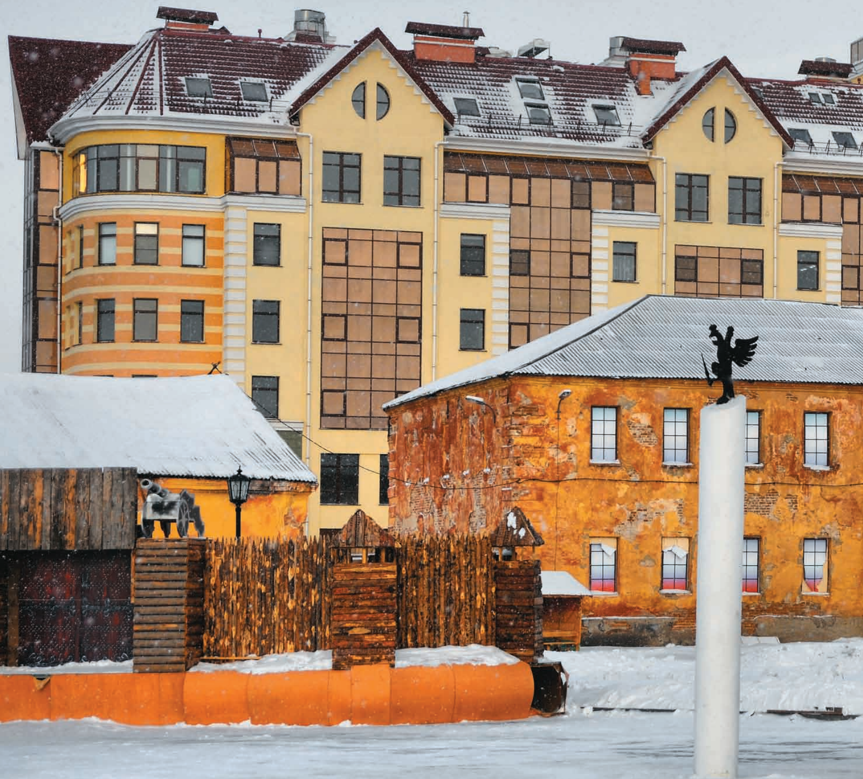
Памятный знак в честь основания Омска (скульптор С. А. Голованцев) у Тобольских ворот Омской крепости. Фотография А. Ю. Кудрявцева