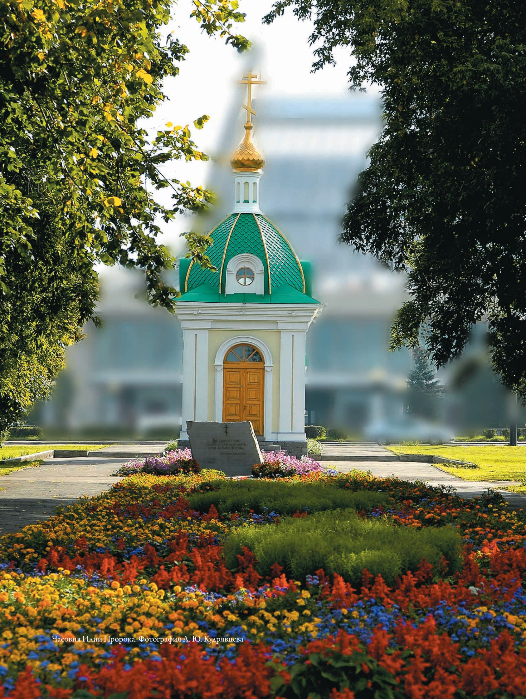
Часовня Ильи Пророка.