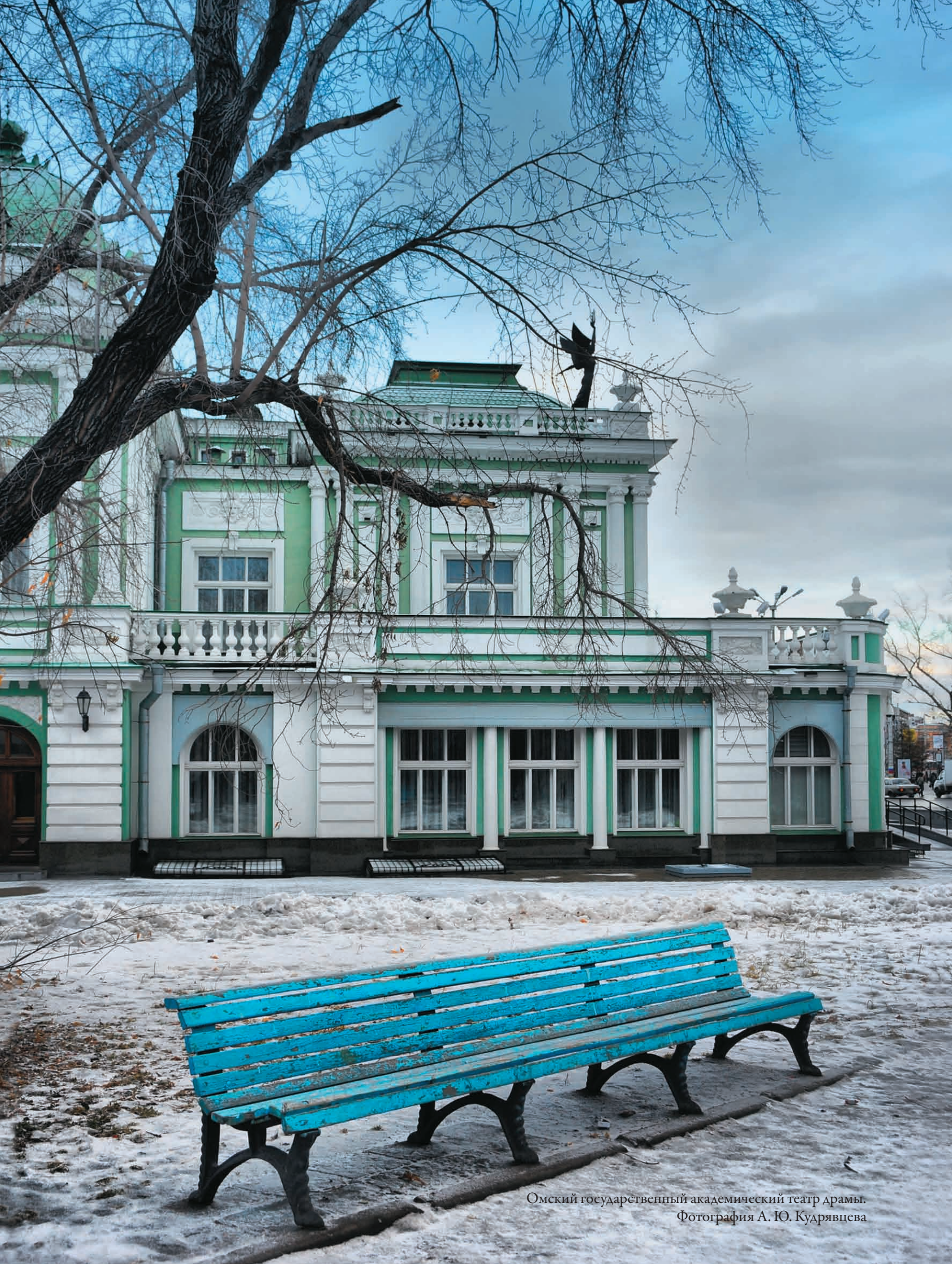
Омский государственный академический театр драмы.