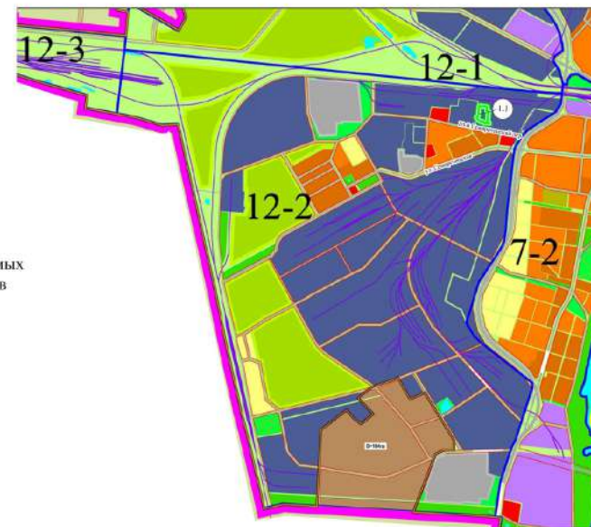
Схема расположения элемента планировочной структуры 1.1 в границах планировочного элемента 12-2, установленного Схемой планировочных элементов территории города Омска для разработки градостроительной документации в составе Генерального плана муниципального образования городской округ город Омск Омской области