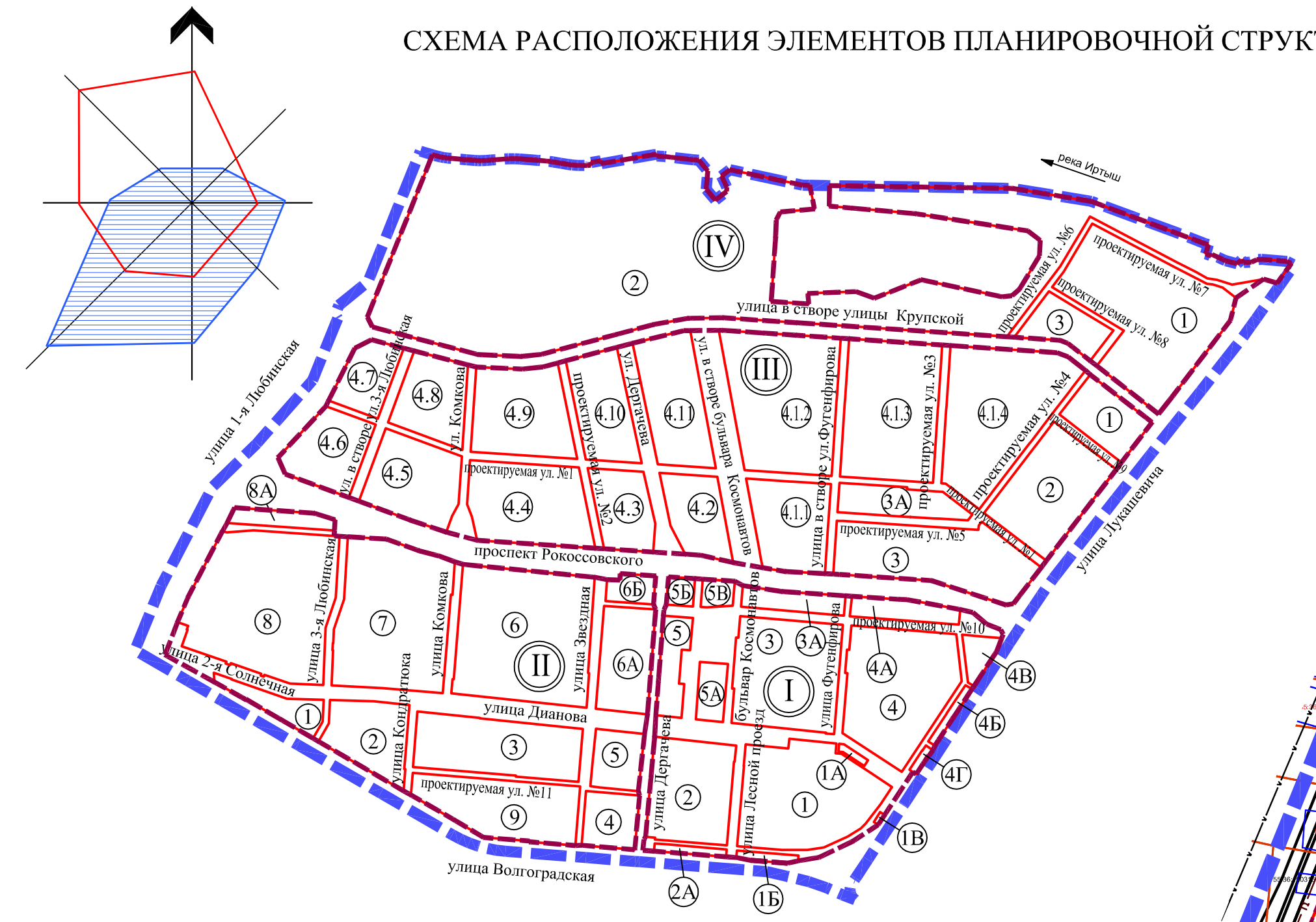
СХЕМА РАСПОЛОЖЕНИЯ ЭЛЕМЕНТОВ ПЛАНИРОВОЧНОЙ СТРУКТУРЫ