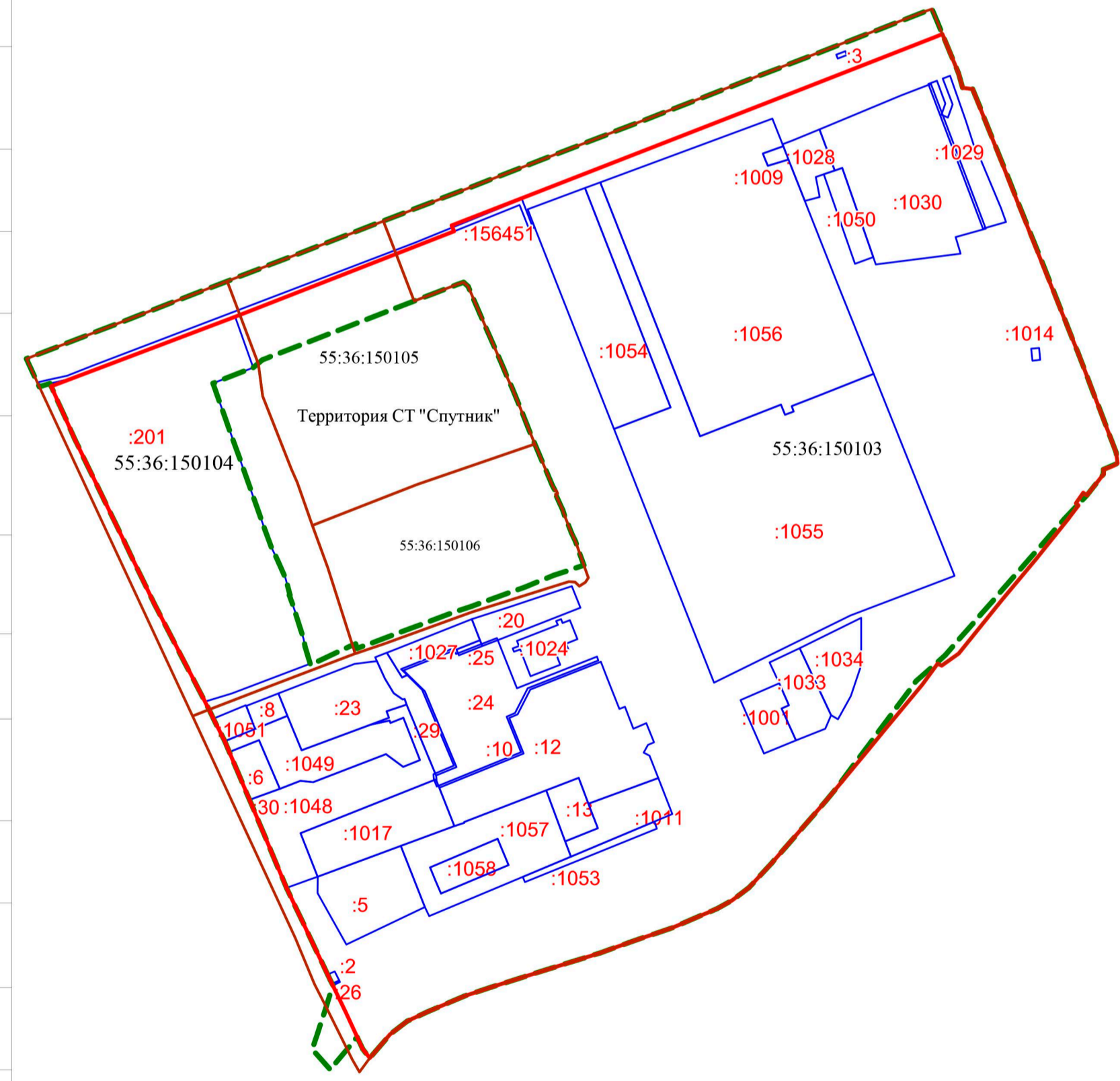
Схема кадастрового плана