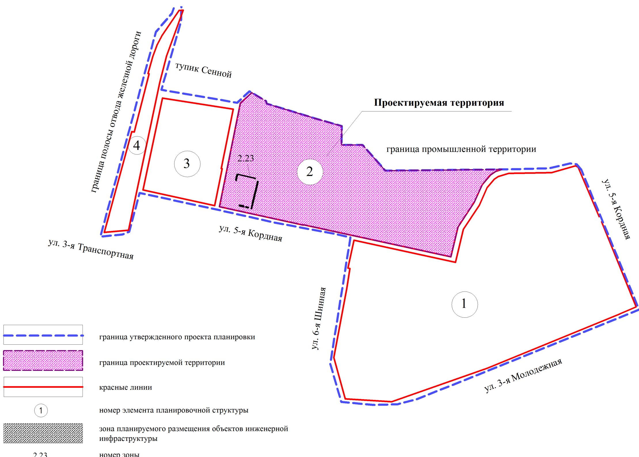
СХЕМА РАСПОЛОЖЕНИЯ ГРАНИЦ ПРОЕКТИРОВАНИЯ И ЭЛЕМЕНТОВ ПЛАНИРОВОЧНОЙ СТРУКТУРЫ ПРОЕКТА ПЛАНИРОВКИ ТЕРРИТОРИИ, РАСПОЛОЖЕННОЙ В ГРАНИЦАХ: ТУПИК СЕННОЙ – ГРАНИЦА ПРОМЫШЛЕННОЙ ТЕРРИТОРИИ – УЛИЦА 5-Я КОРДНАЯ – УЛИЦА 3-Я МОЛОДЕЖНАЯ – УЛИЦА 6-Я ШИННАЯ – УЛИЦА 5-Я КОРДНАЯ – УЛИЦА 3-Я ТРАНСПОРТНАЯ – ГРАНИЦА ПОЛОСЫ ОТВОДА ЖЕЛЕЗНОЙ ДОРОГИ – В ОКТЯБРЬСКОМ АДМИНИСТРАТИВНОМ ОКРУГЕ ГОРОДА ОМСКА