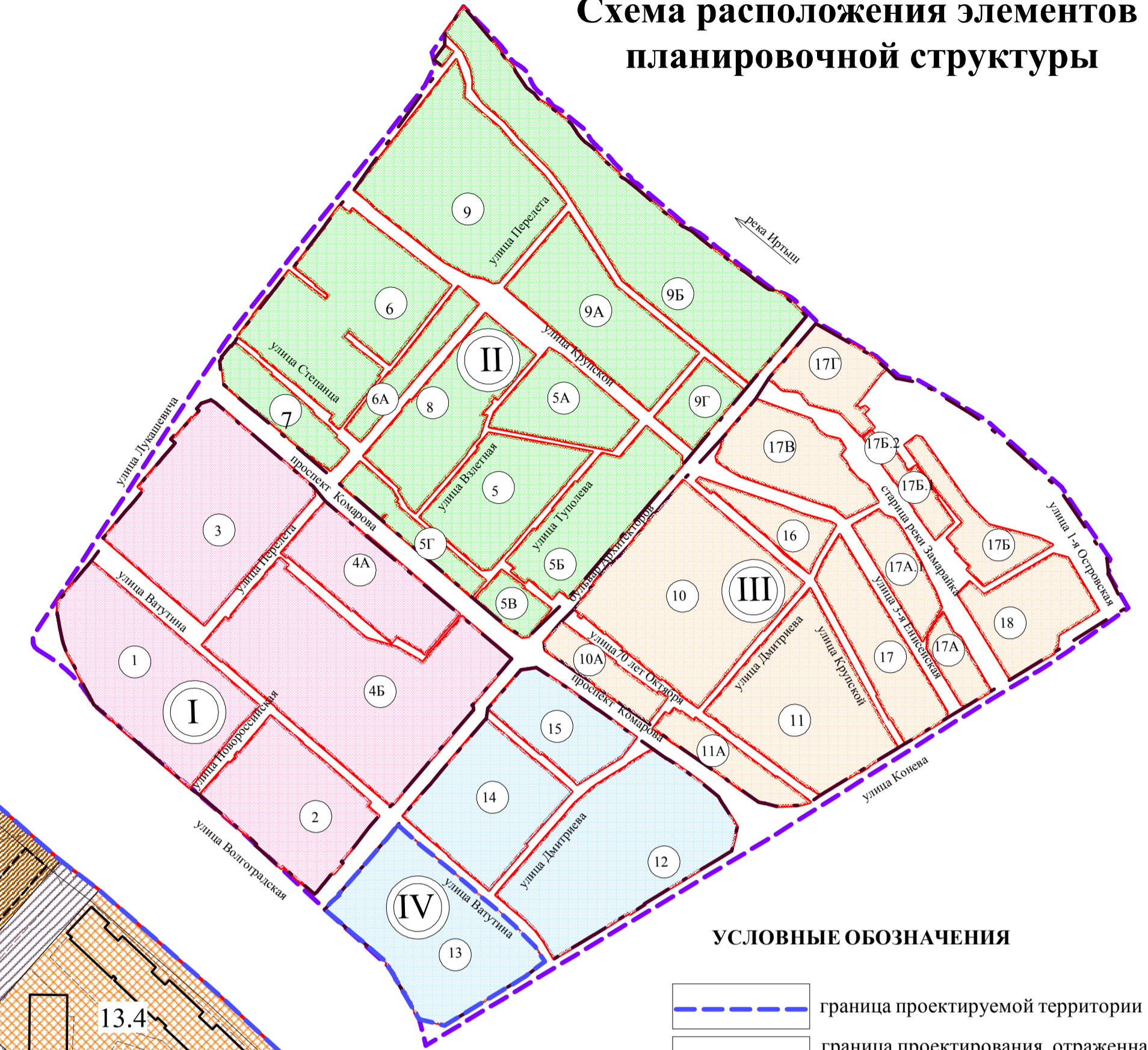
Схема расположения элементов планировочной структуры