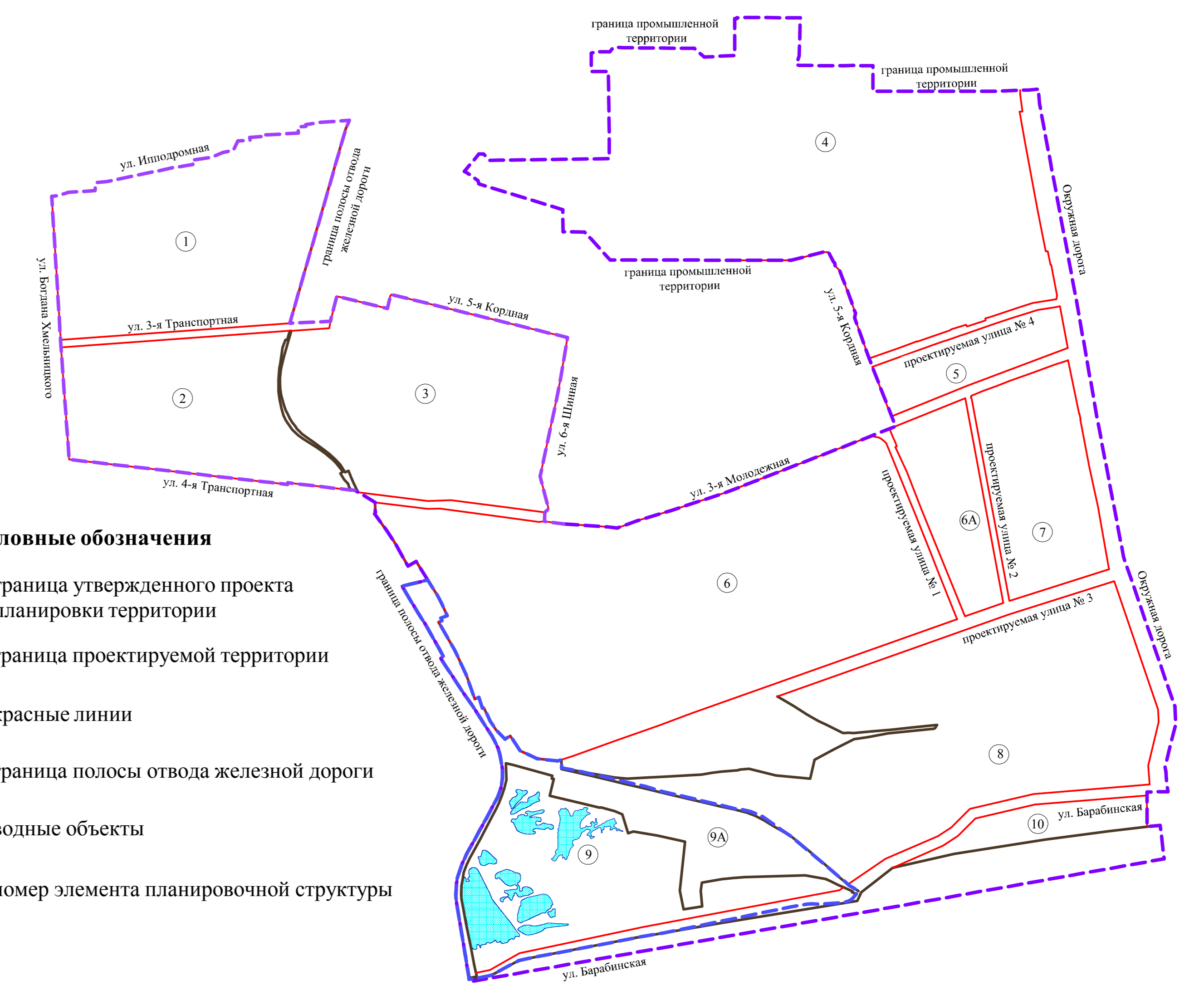
Схема расположения элементов планировочной структуры