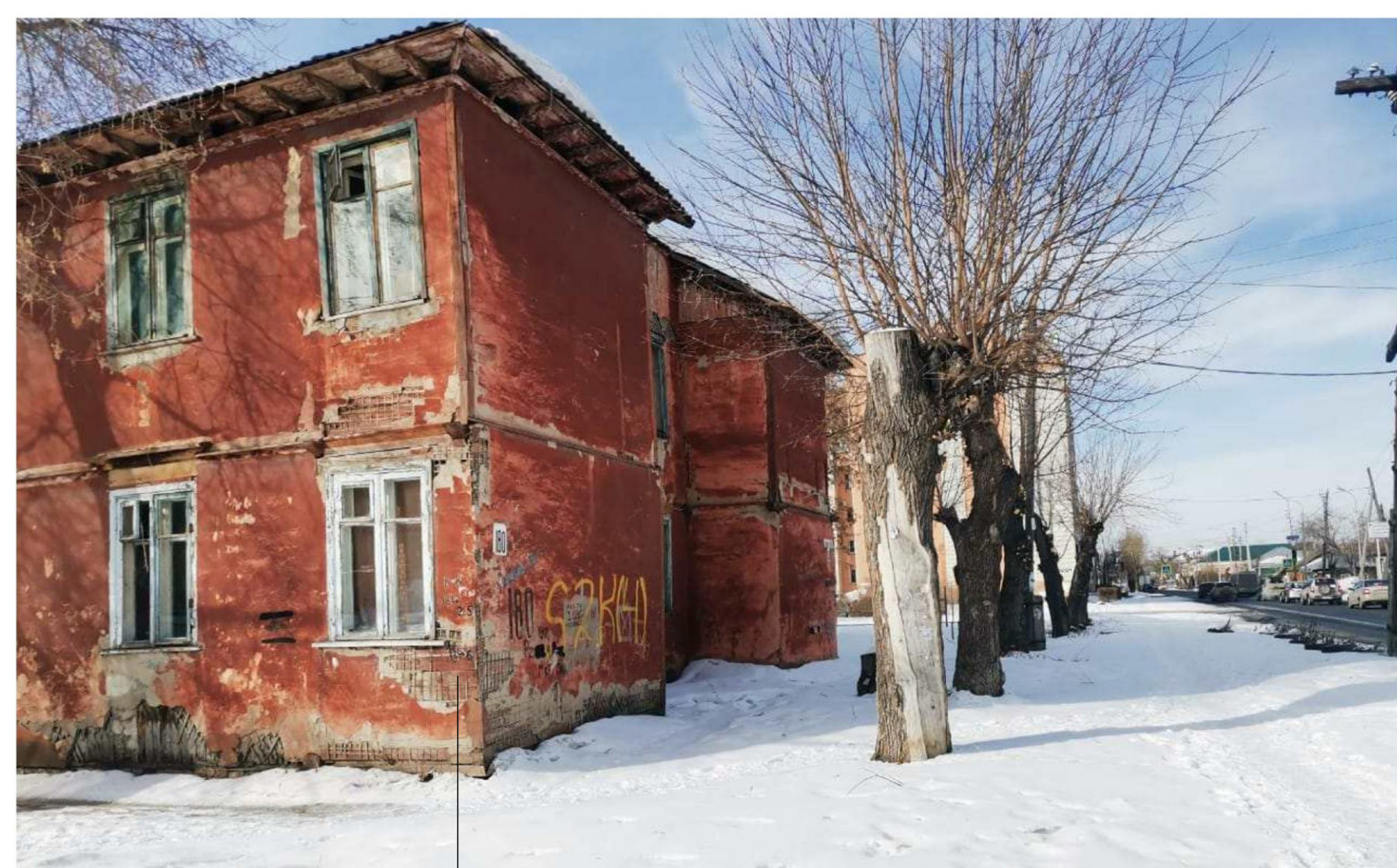
площадки под строительство объектов жилой застройки средней этажности