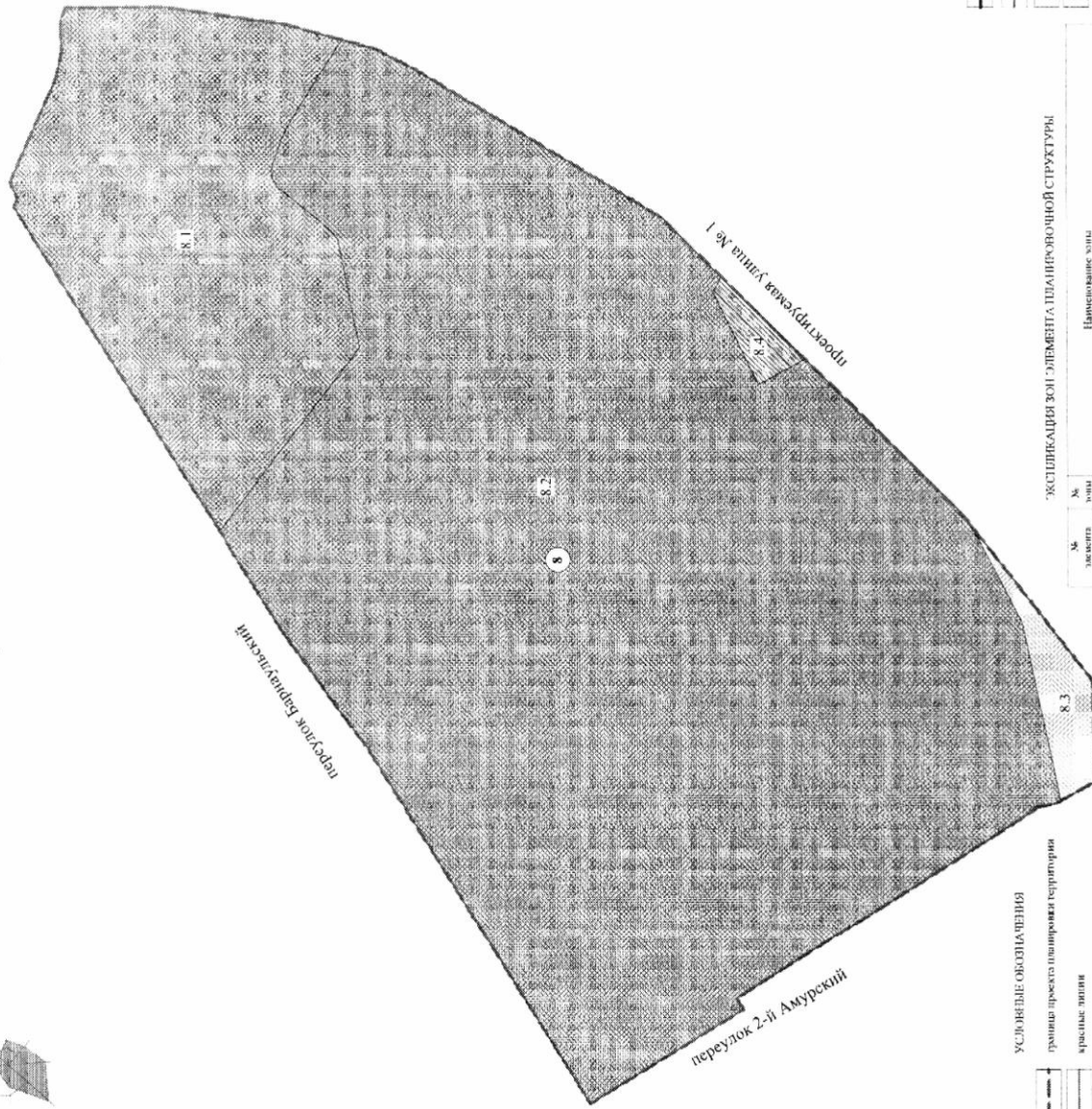
Схема элементов планировочной структуры проекта планировки территории, расположенной в границах улицы Челюскинцев – улица 21-й Амурская – граница полосы отвода железной дороги – граница промышленной территории – улицы Пристанционная – улицы 35 лет Советской Армии в Центральном административном округе города Омска

Чертеж планировки территории элемента планировочной структуры № 8 проекта планировки территории, расположенной в границах улицы Челюскинцев – улица 21-й Амурская – граница полосы отвода железной дороги – граница промышленной территории – улица Пристанционная – улицы 35 лет Советской Армии в Центральном административном округе города Омска