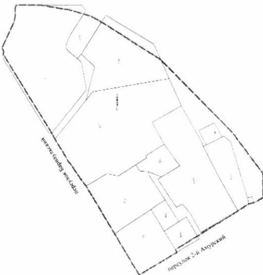
Схема кадастрового плана территории М 1:2000