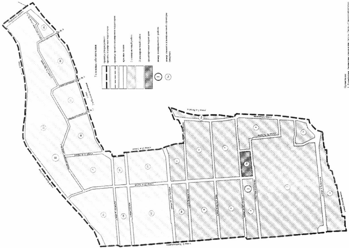
Схема расположения границ проектируемой элементной планировочной структуры проекта планировки территории в границах: улица Б. Хмельницкого – левый берег реки Оми – Окружная дорога – улица 2-я Липиная – улица Лермонтова – улица 3-й Разъезд – улица Берникова – улица Ипподромная – в Центральном, Октябрьском административных округах города Омска