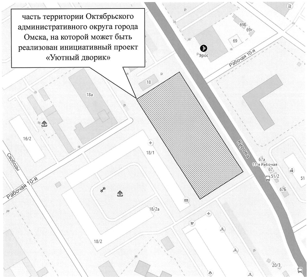
СХЕМА границ части территории Октябрьского административного округа города Омска, на которой может быть реализован инициативный проект «Уютный дворик»