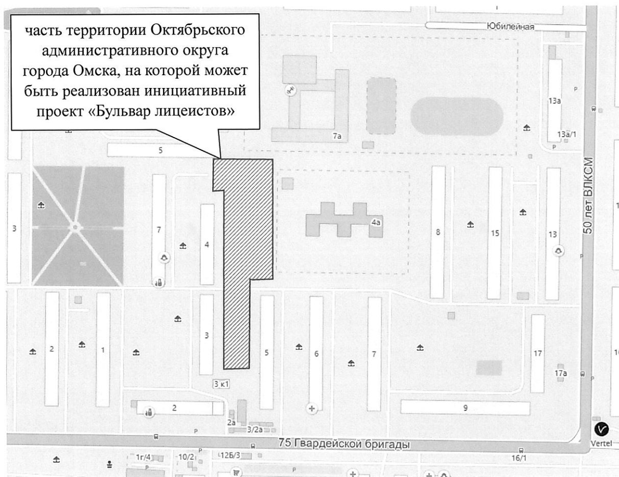
СХЕМА границ части территории Октябрьского административного округа города Омска, на которой может быть реализован инициативный проект «Бульвар лицеистов»