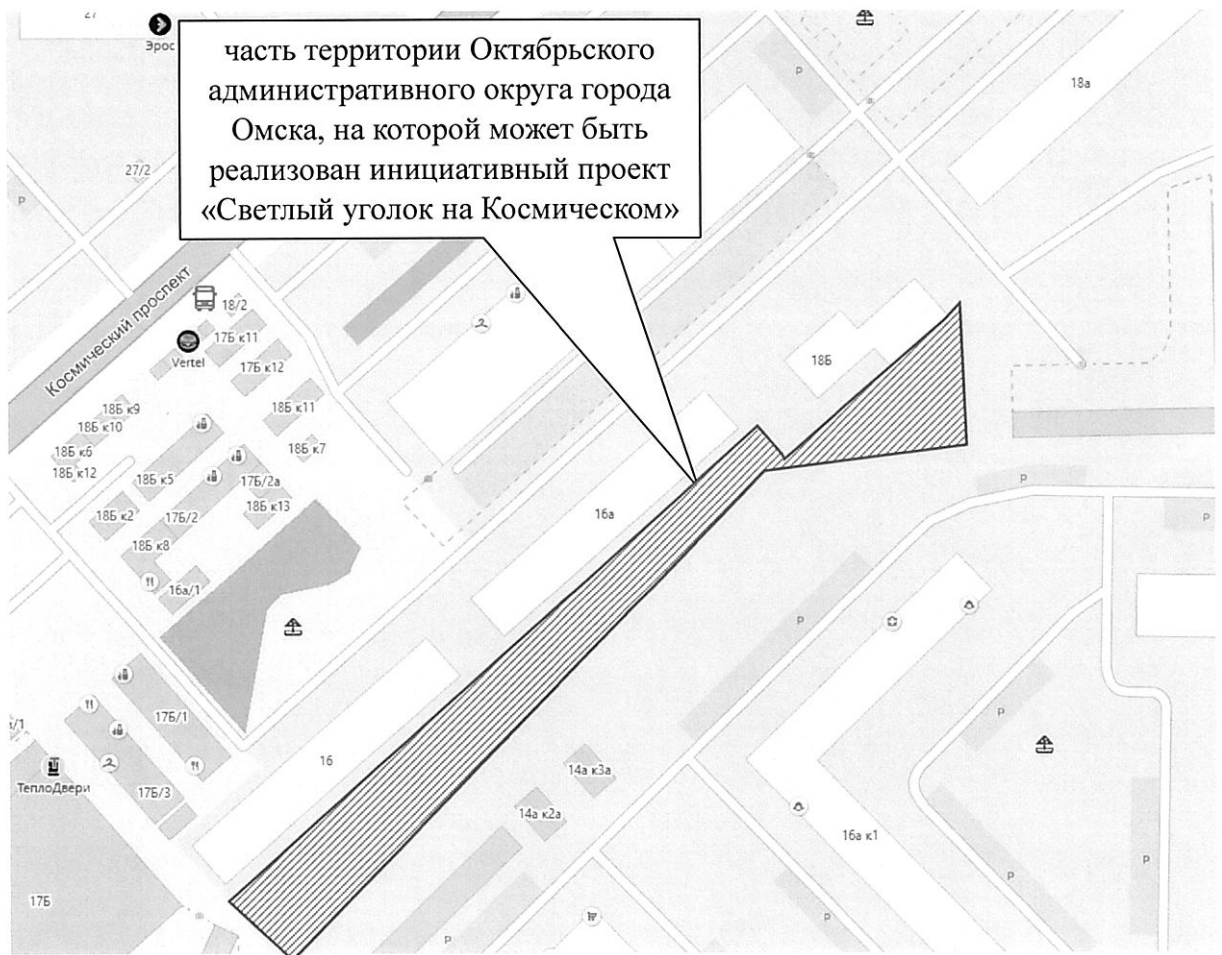
СХЕМА границ части территории Октябрьского административного округа города Омска, на которой может быть реализован инициативный проект «Светлый уголок на Космическом»