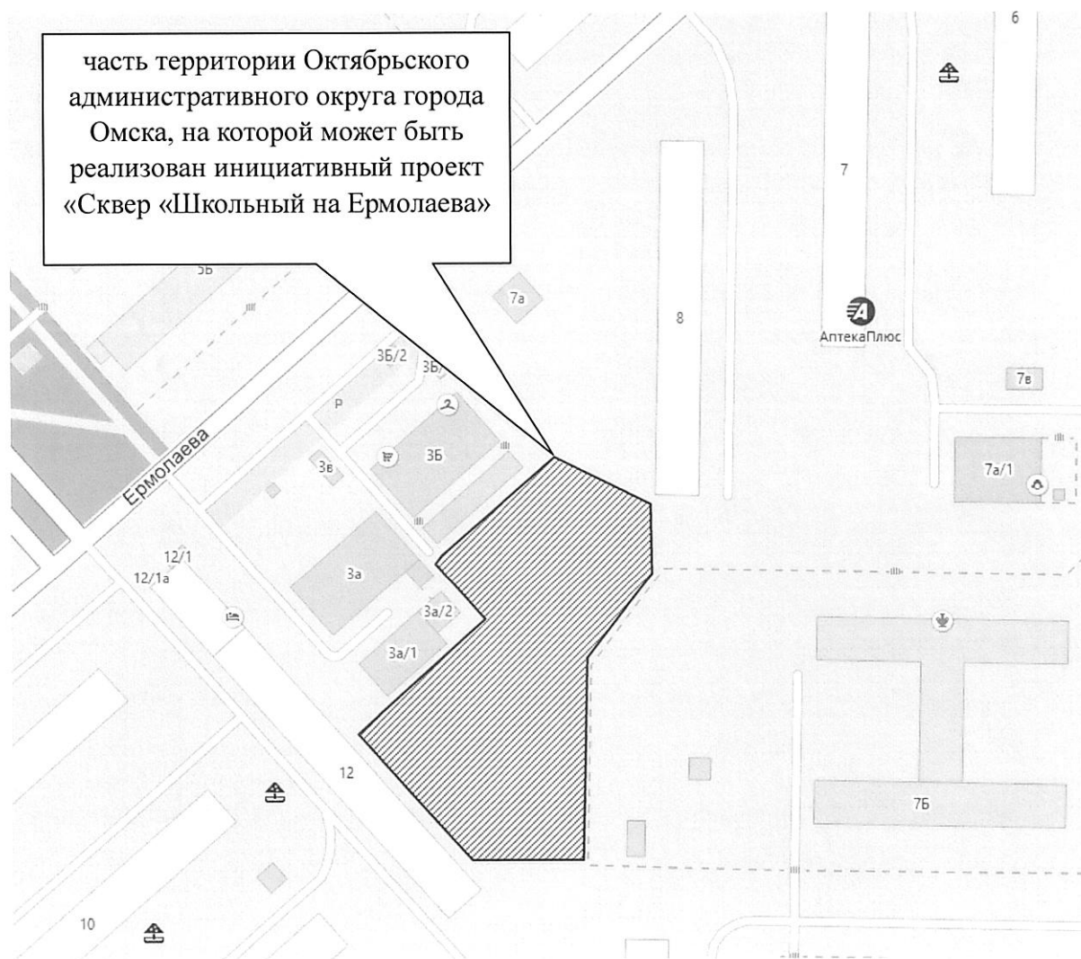
СХЕМА границ части территории Октябрьского административного округа города Омска, на которой может быть реализован инициативный проект «Сквер «Школьный на Ермолаева»