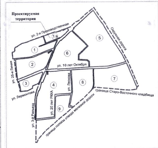
Схема расположения элемента планировочной структуры