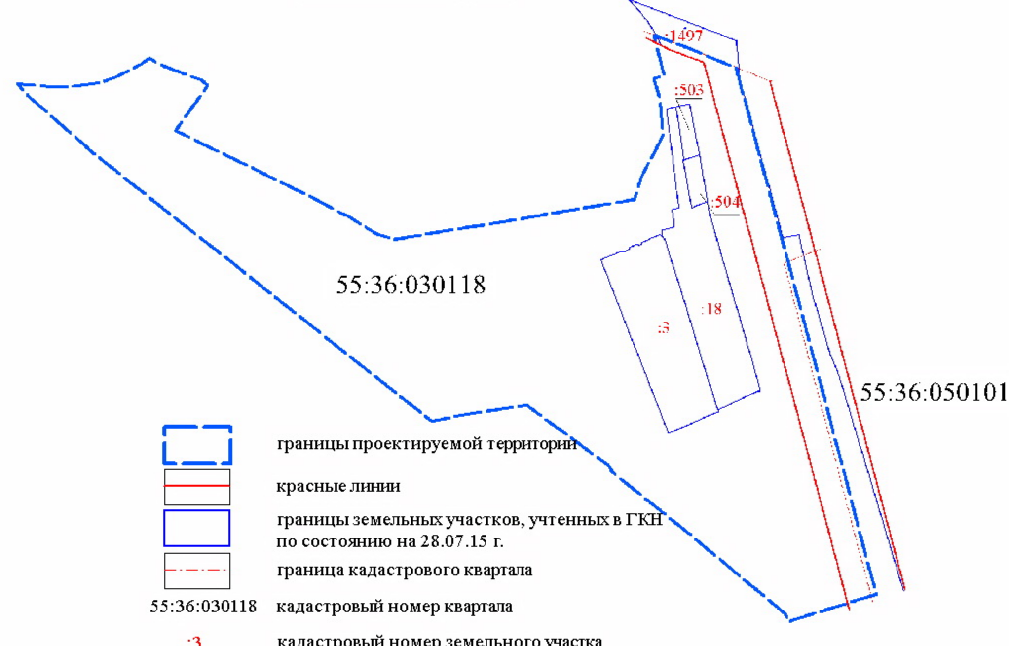
Схема кадастрового плана