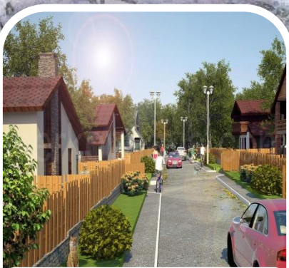
5 ЛУЧШАЯ УЛИЦА индивидуальной жилой застройки