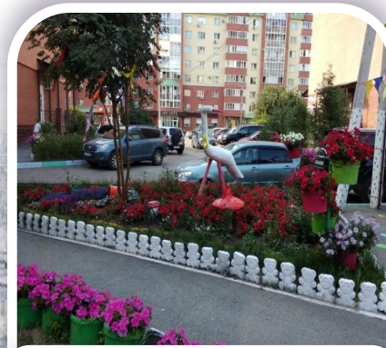
4 ЛУЧШИЙ ДВОР многоквартирного дома