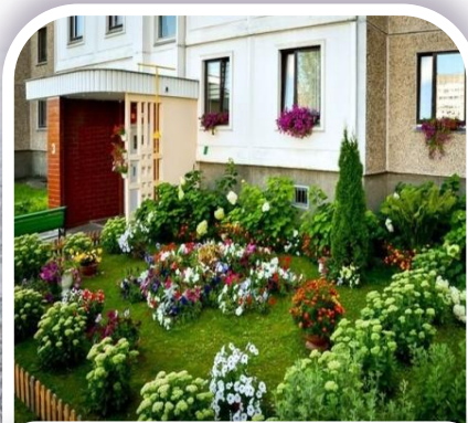
3 ЛУЧШИЙ ПАЛИСАДНИК во дворе многоквартирного дома