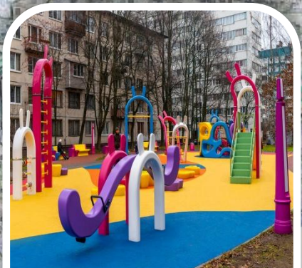
6 ЛУЧШАЯ ДЕТСКАЯ дворовая площадка