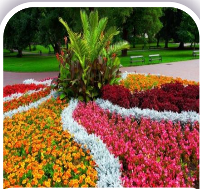
1 ЛУЧШАЯ КЛУМБА во дворе многоквартирного дома