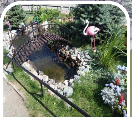
7 ЛУЧШИЙ АРТ-ОБЪЕКТ