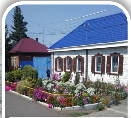
2 ЛУЧШИЙ ПАЛИСАДНИК дома индивидуальной жилой застройки