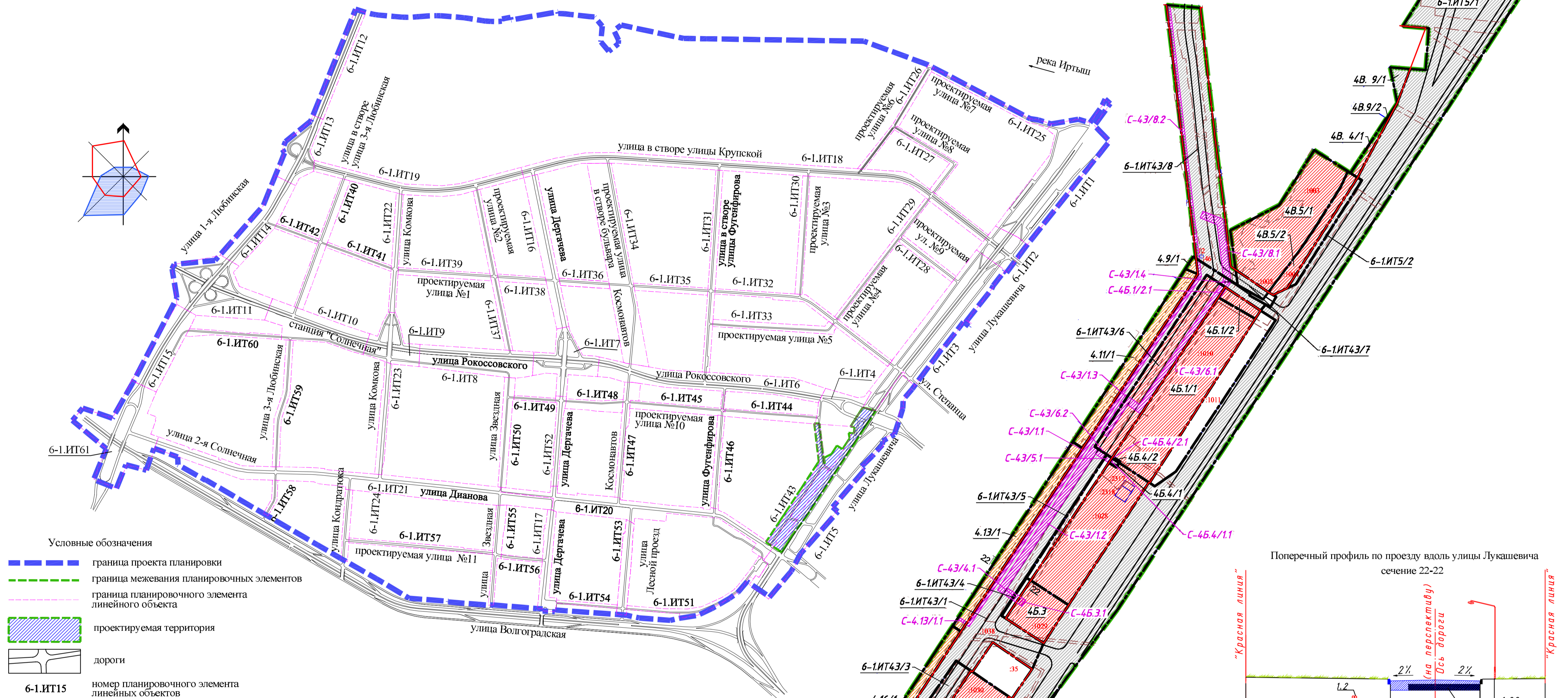
Схема расположения границ планировочных элементов линейных объектов проекта планировки территории, расположенной в границах: улица Лукашевича - улица Волгоградская - улица 1-я Любимская - левый берег реки Иртыш в Кировском административном округе города Омска