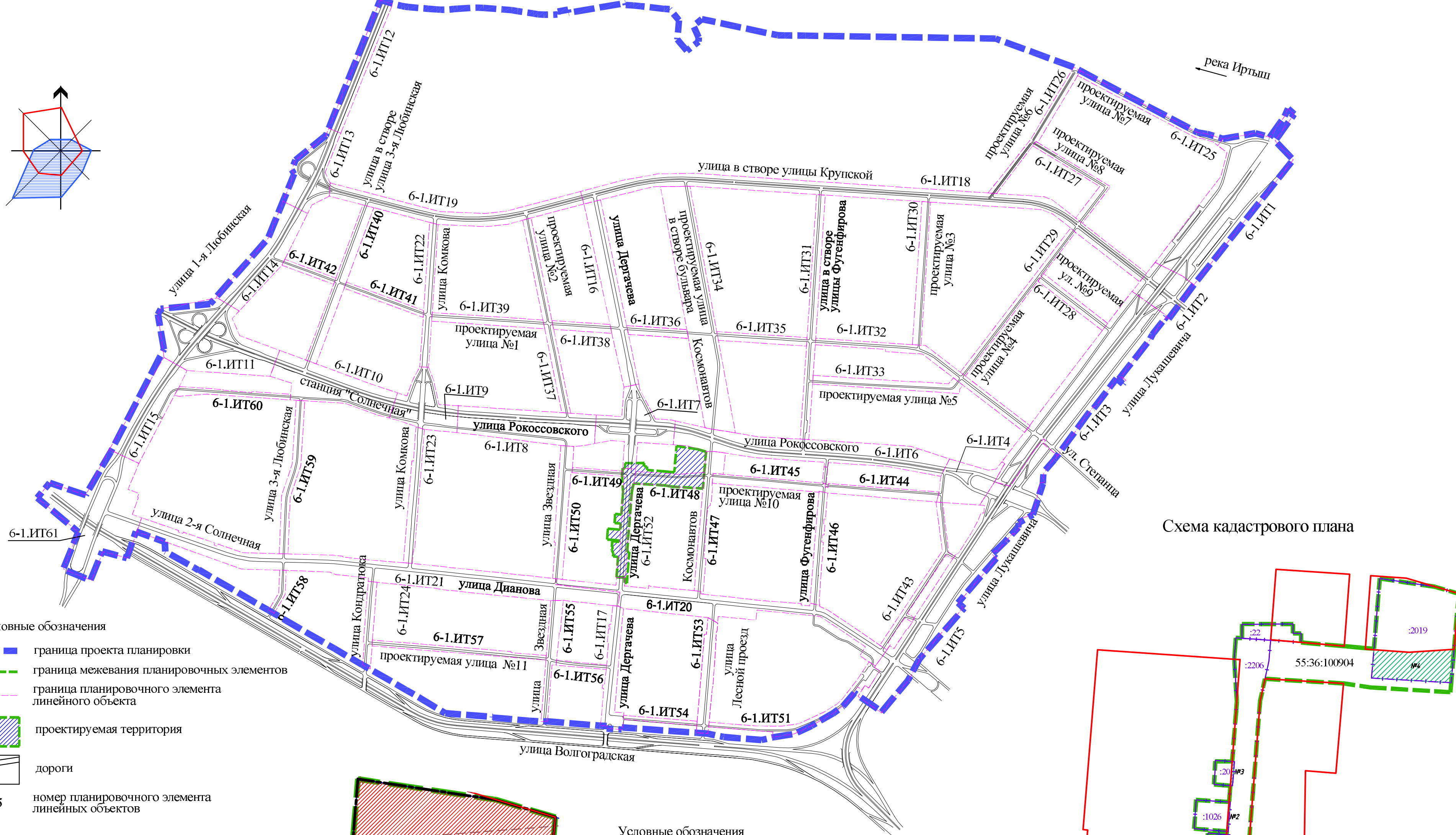
Схема расположения границ планировочных элементов линейных объектов проекта планировки территории, расположенной в границах: улица Лукашевича - улица Волгоградская - улица 1-я Люблинская - левый берег реки Иртыш в Кировском административном округе города Омска

Чертеж межевания территории, предназначенной для размещения линейных объектов по улицам: проектируемая улица №10, Дергачева в Кировском административном округе города Омска (планировочные элементы №№ 6-1.ИТ48, 6-1.ИТ52)