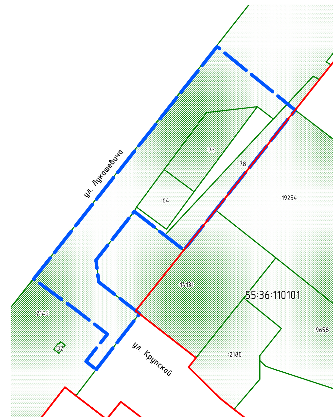
Схема кадастрового плана территории