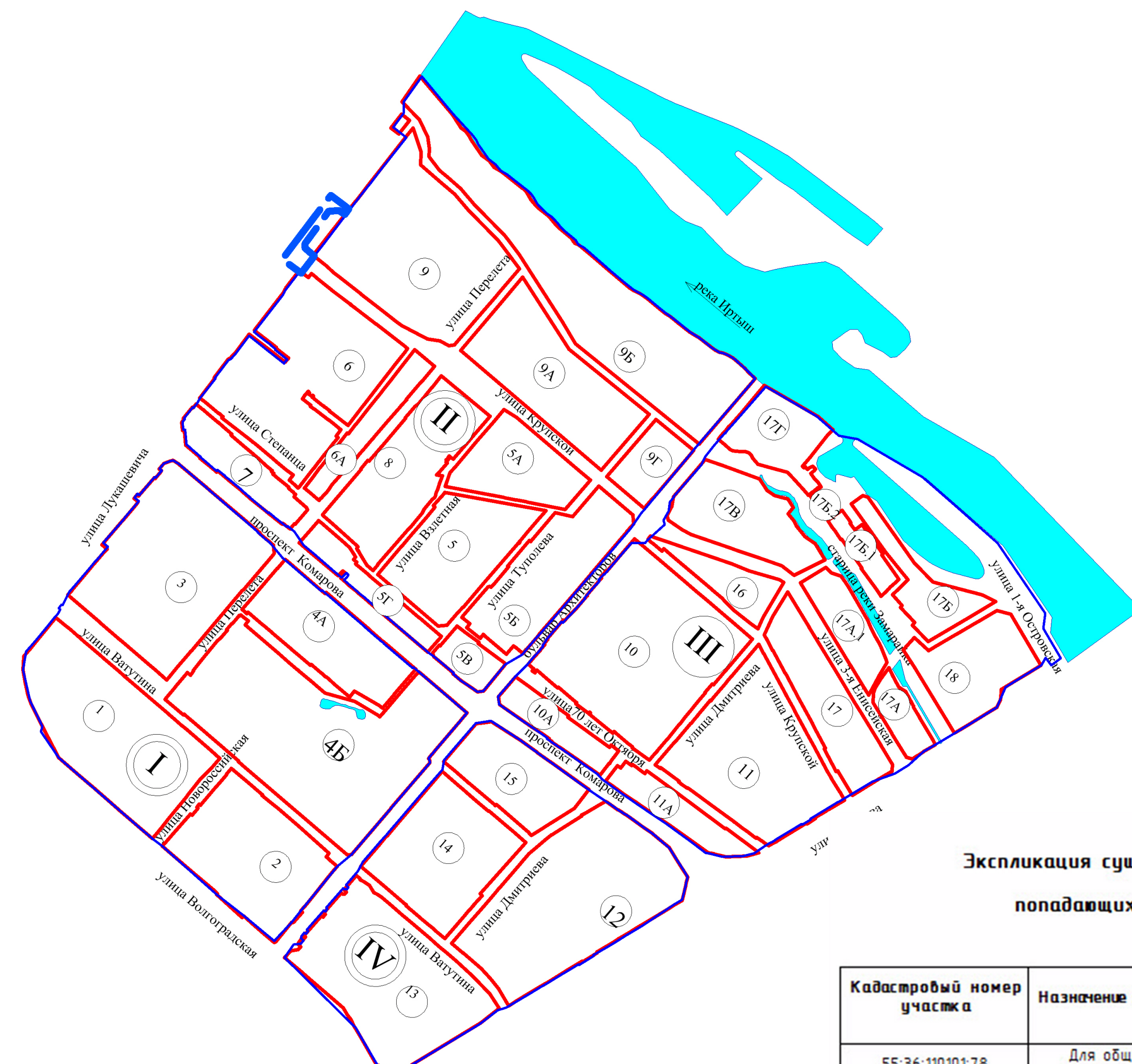
СХЕМА РАСПОЛОЖЕНИЯ ЭЛЕМЕНТОВ ПЛАНИРОВОЧНОЙ СТРУКТУРЫ