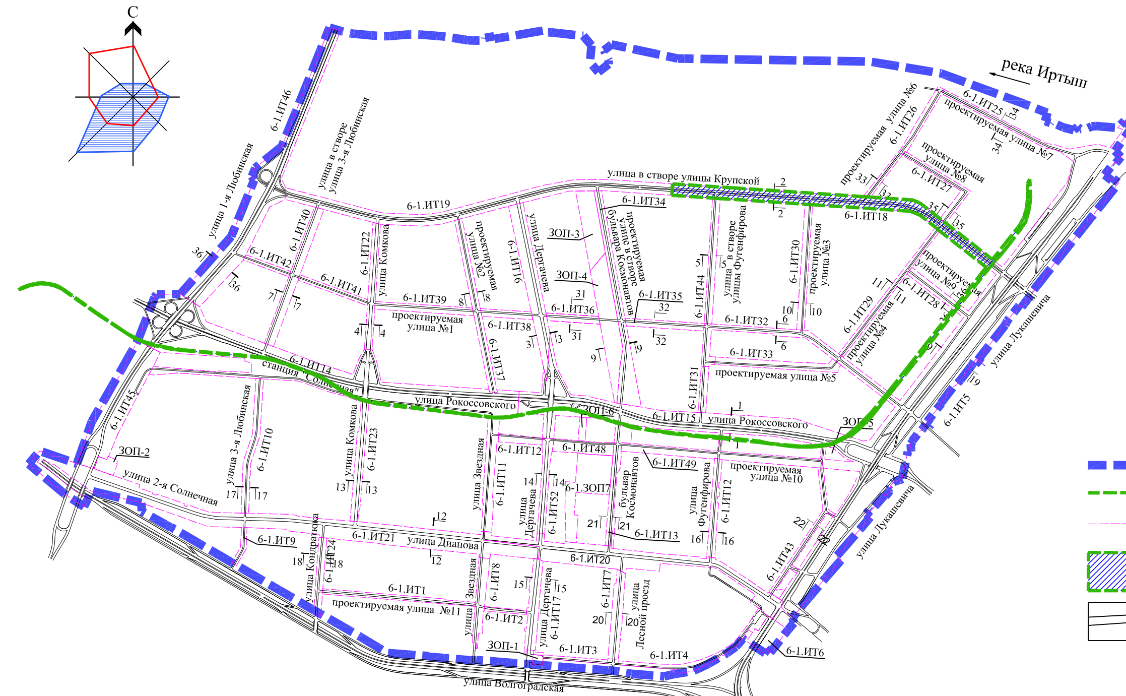
Схема расположения границ планировочных элементов линейных объектов проекта планировки территории, расположенной в границах: улица Лукашевича - улица Волгоградская - улица 1-я Любинская - левый берег реки Иртыш в Кировском административном округе города Омска

Приложение № к постановлению Администрации города Омска от _____ № _____