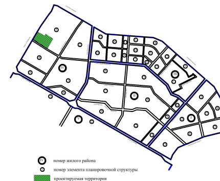
Схема расположения границ проектирования и элементов планировочной структуры