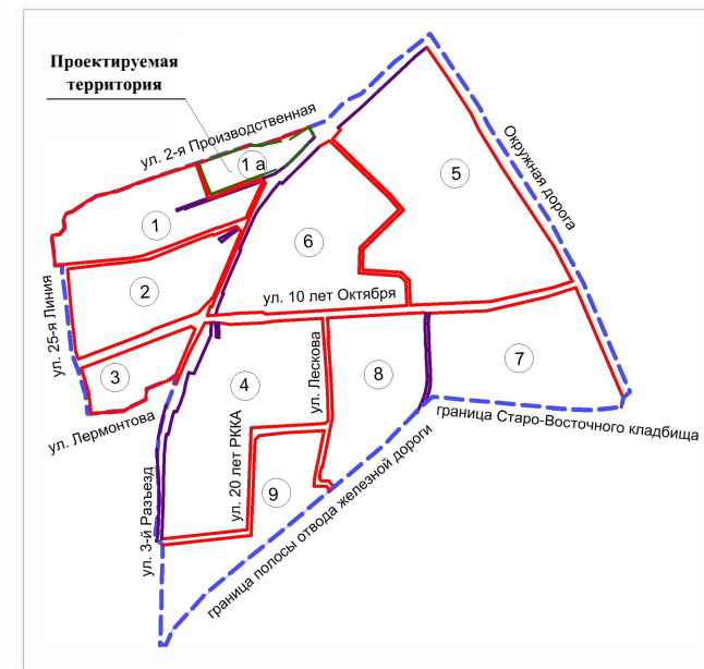
Схема расположения элемента планировочной структуры